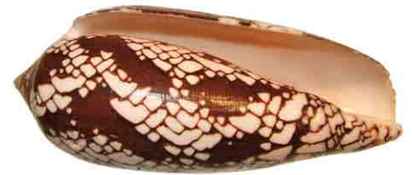
Stožčasti polž Conus aulicus .