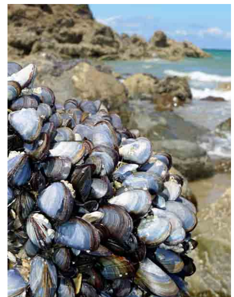
Mediterranska klapavica ( Mytilus galloprovincialis ).

Čarobni svet školjk v tej številki Trdoživa tudi nagrajuje. Več na strani 42.