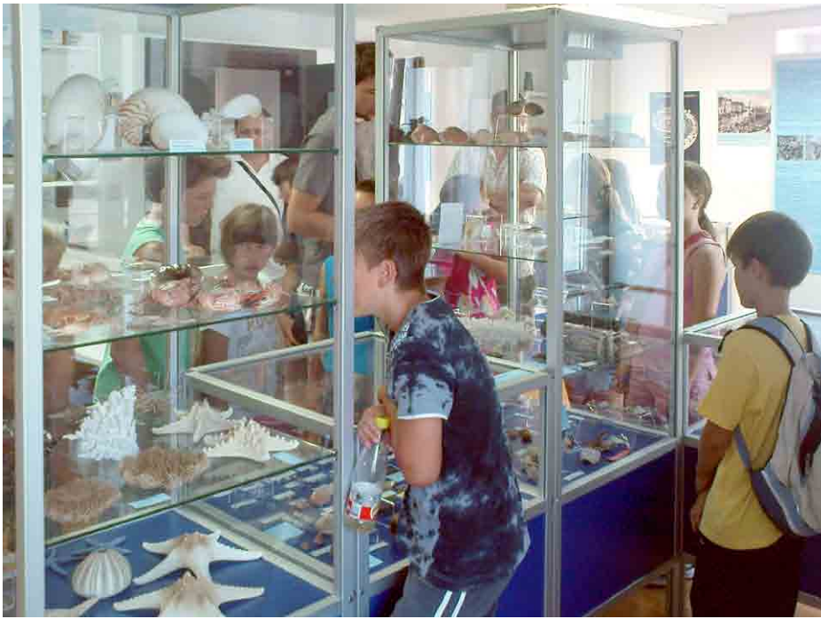
Razstava je poučna in zanimiva tako za mlade kot tudi za starejše.

V Čarobnem svetu školjk je razstavljenih več kot 2.000 vrst polžev in školjk s celega sveta, poleg tropskih vrst tudi večina vrst Jadranskega morja. Med drugimi so razstavljeni tudi lupina največjega polža na svetu Syrinx aruanus , hišice polžev, ki so jih zaradi redkosti smeli nositi zgolj poglavarji oddaljenih otočij, svetleče lupine, s katerimi se je nekoč lahko kupilo tudi sužnja, školjke z osupljivimi vzorci in celo biseri. Že samo zaradi tega se je vredno odpraviti na izlet v Piran in se o edinstvenosti razstave prepričati na lastne oči.