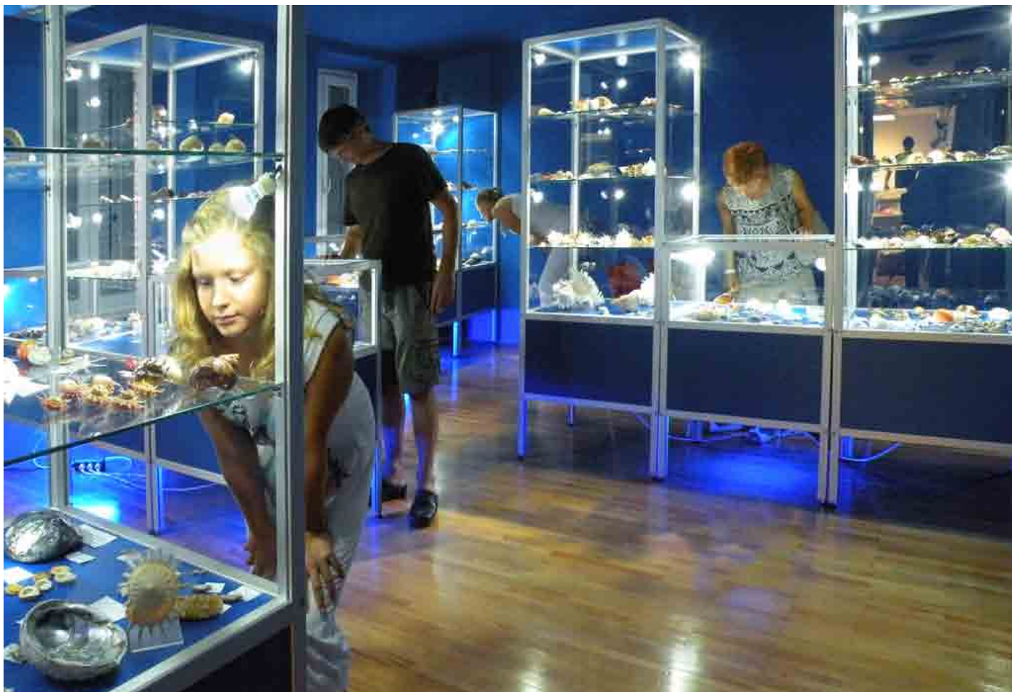
Morski del razstave z lupinami iz tropskih morij.