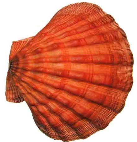
Pokrovača Pecten subnodosus .

Čarobni svet školjk, Tartinijev trg 15, Piran.