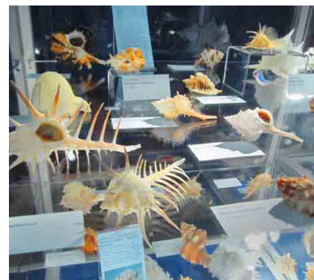
Predogled v družino polžev volekov (Muricidae).

mi, sladkovodnimi in morskimi školjkami ter polži, skratka z vsemi življenjskimi okolji, v katerih ta bitja živijo. Čeprav je od odprtja razstave preteklo šele leto, je gostila že veliko obiskovalcev, jih prijetno presenetila, očarala in navdušila.