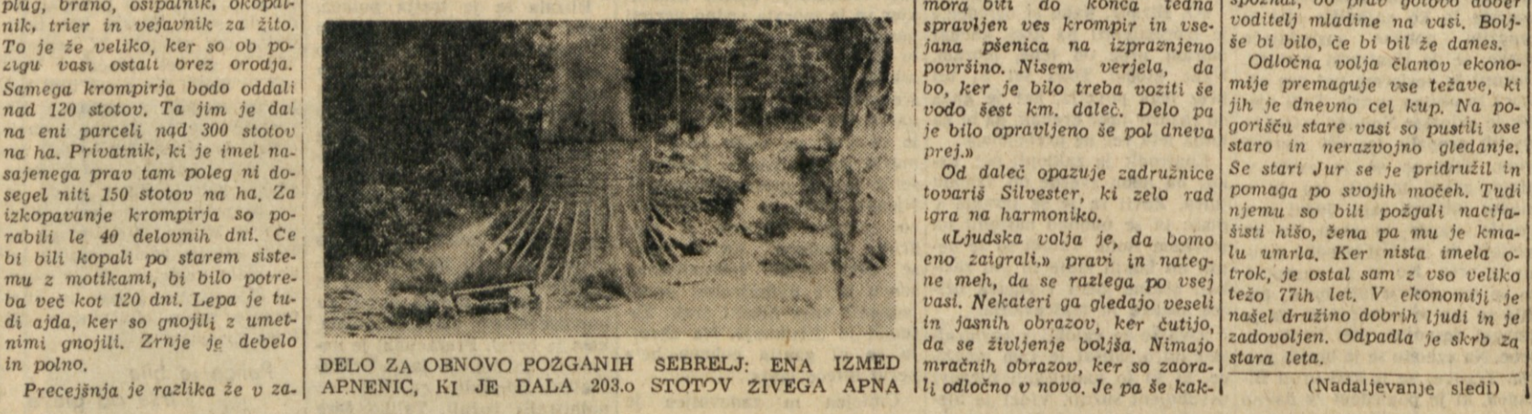
DELO ZA OBNOVO POZGANIH SEBRELJ: ENA IZMED APNEVIC, KI JE DALA 203.0 STOTOV ZIVEGA APNA