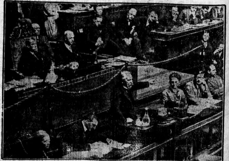
ARISTIDE BRIAND GOVORI KOT ZUNANJI MINISTER FRANCIJE SVOJ ZADNJI VELIKI POLITIČNI GOVOR PRED DRUŠTVOM NARODOV V ŽENEVI.

Ne pozabite! Nocoj pojdite v Narodni dom! Spored: Prosta zabava - ples - 20 h .