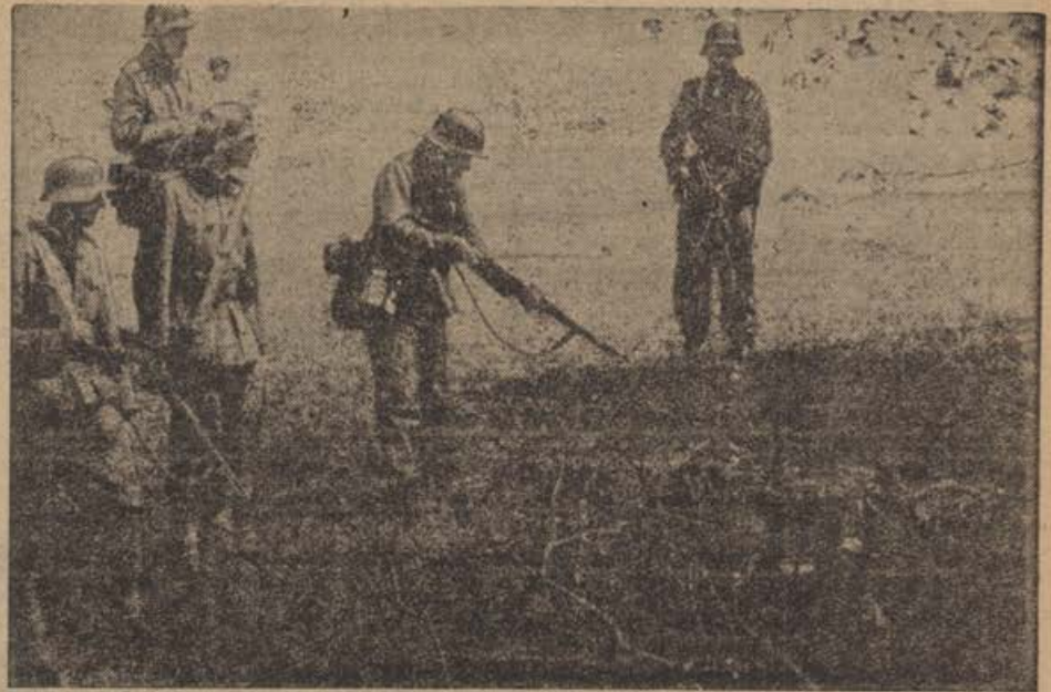
Im Angriff an der Ostfront

Junija 1941 je ugotovil letak, označen s komunističnim simbolom srpa in kladiva, »da je postalo osvobodilno gibanje slovenskega ljudstva vsled inicijative in vodstva komunistične stranke Slovenije — stvarnost«.