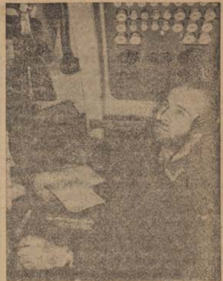
Siegesmeldung aus dem Atlantik Der Funkmaat stimmt den Sender ab, um die Siegesmeldung aus dem Atlantik in die Heimat zu funken

Na podlagi teh dejstev nudimo — tako pravi proklamacija — Spodnještajercem največjo šanso: Spodnještajerci in njih potomci lahko zrastejo v nemško narodno in usodno skupnost. Prav tako pa je tudi jasno, da je ta šansa samo enkratna. Zato ni mogoče, da bi se nekdo postavil na stališče: Počaka bom, kaj se bo zgodilo, morda pa imajo le tisti prav, ki so vedno lagali. Kdor bi se postavil na tako napačno stališče, si bo moral pozneje sam pripisati vse posledice. Izkazalo se je, da nasprotniki nemškega ljudstva niso imeli nikdar prav. Proklamacija našteva vse laži, ki so jih trosili nasprotniki Nemčije od izbruha poljske vojne pa vse do danes. Potek vojne vse do