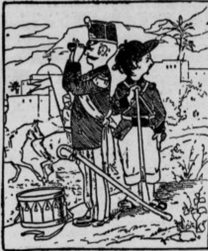
Kje je Turek in Arabec?