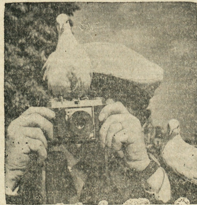
FOTOGRAFA — Izletniku v Parizu se je pri fotografiranju pridružil golob. Ta je moral biti z gostom brez dvoma zadovoljen, ker ga je prijazno sprejel.