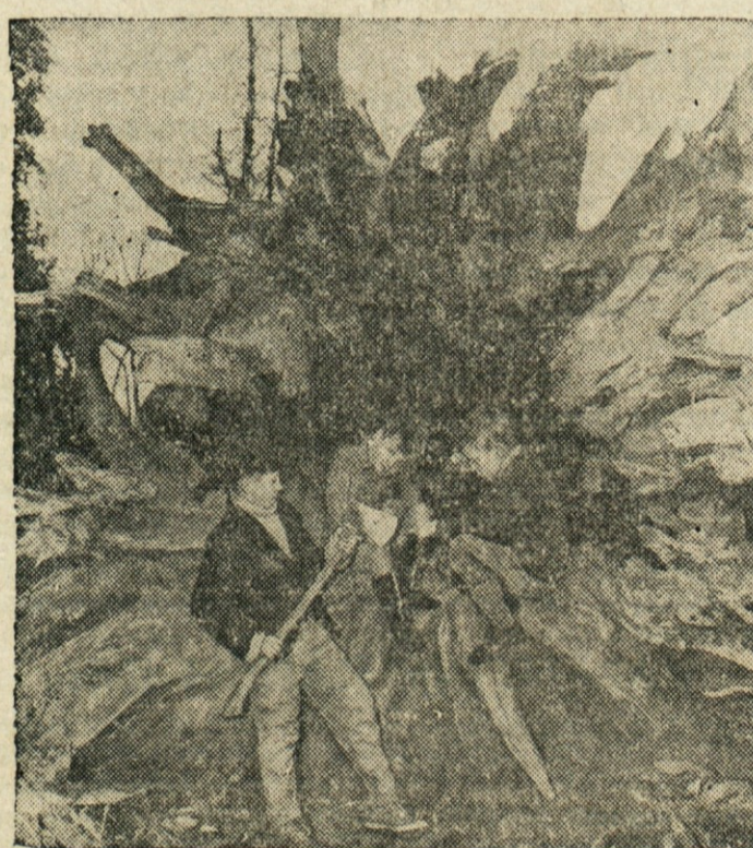
H KORENINI — Trije dečki v Molesey na Angleškem se pripravljajo na sekanje korenin drevesa, ki ga je podrl vihar.