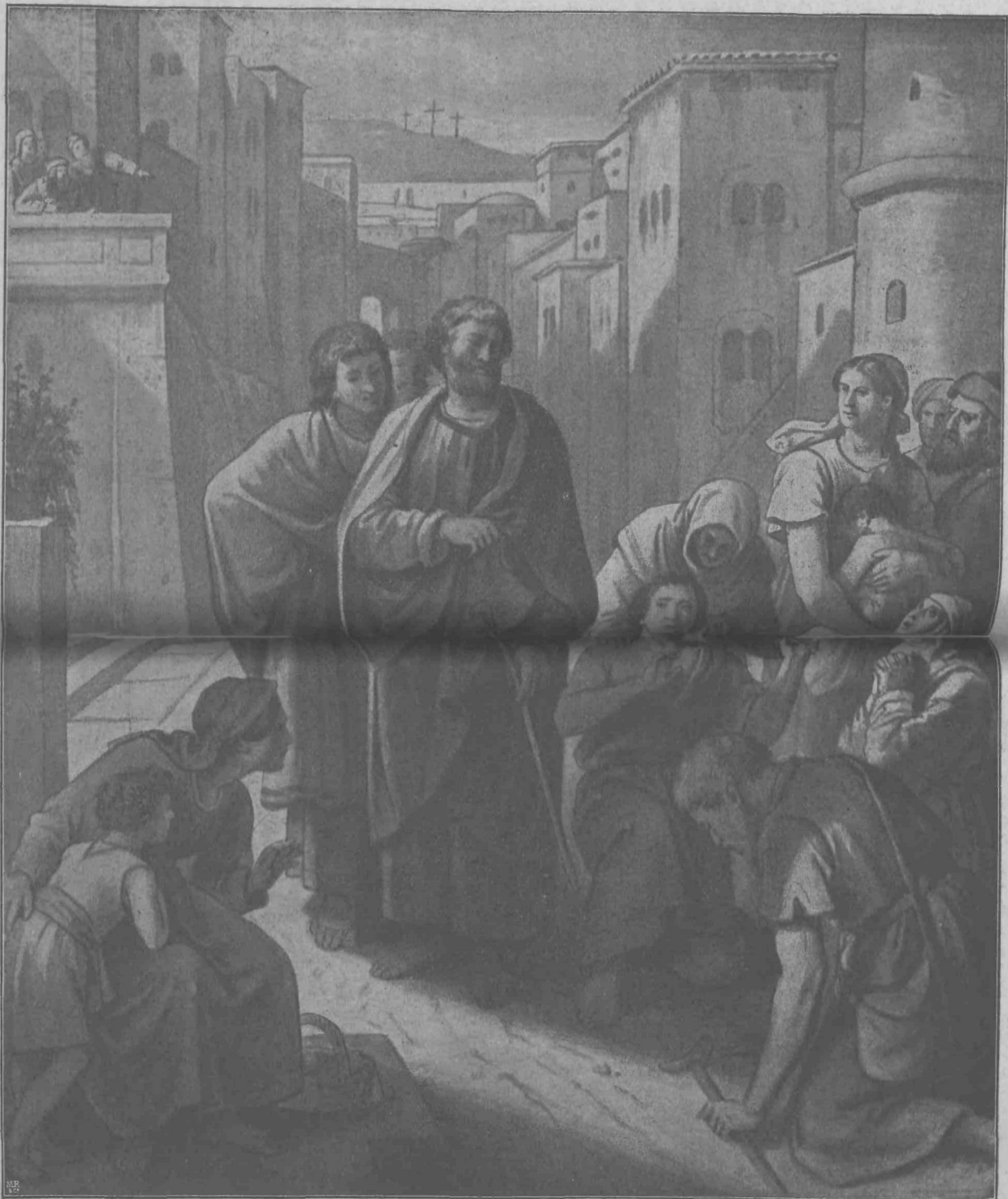
Senca sv. Petra ozdravlja bolnike.