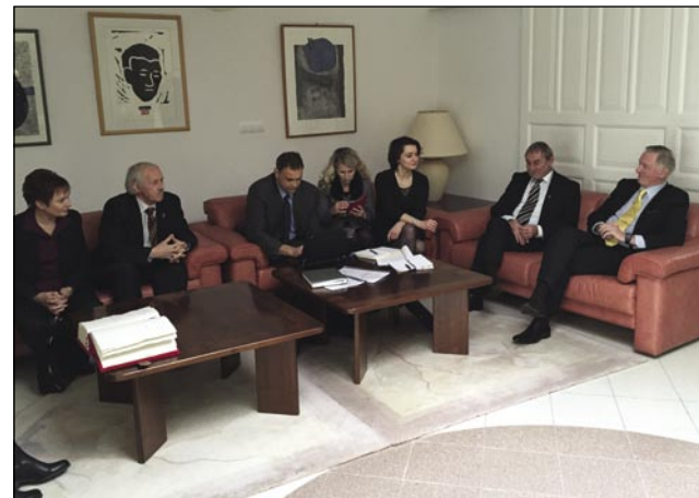
Minister Gorazd Žmavc (prvi z desne) je predstavnike Porabskih Slovencev sprejel na Veleposlaništvu RS

Uradni obisk Gorazda Žmavca se je zaključil na Veleposlaništvu RS v Budimpešti. Na povabilo