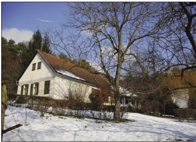
Locüvéno ižo na brgej samo tisti najde, steri vej, ka je tam

»Prvin smo celau dosta delali, zato ka stariške so maro