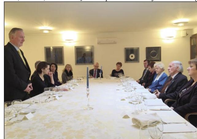
Po pozdravnem govoru ministra so Slovenci na Madžarskem predstavili svoje poglede na položaj narodnosti

»Sem zadovoljen, da sem danes vzpostavil stik z državnim sekretarjem Soltészom« - je povedal slovenski minister in dodal: »Nisva le izpostavila problemov, temveč sva postavila tudi izhodišča za naprej. Odnos madžarske države do slovenske manjšine v Porabju je zelo pomemben, ker se zavedamo, da spada območje med manj razvite. Moramo skrbeti tako za identiteto, jezik kot za varovanje kulturnega prostora. Na drugi strani pa je potrebno dati več poudarka hitrejšemu gospodarskemu razvoju med državama. Predvsem v tem smislu, da se lahko Porabje hitreje razvija. Moramo torej usposobiti mlade z dobrim šolskim sistemom,