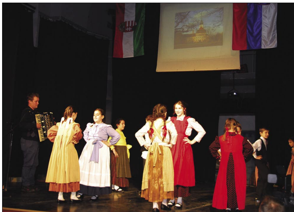
V programi Državne slovenske samouprave smo vidli mlajše skupine števanovske pa gorenjeseničke šaule. Na kejpi folklorna skupina iz Števanovec.