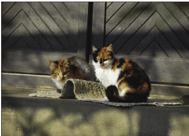
Na sunci sta se segrejala dva lejpa mačka

»Paut je bila, dapa vse so samo s kaulami vozili, kole so