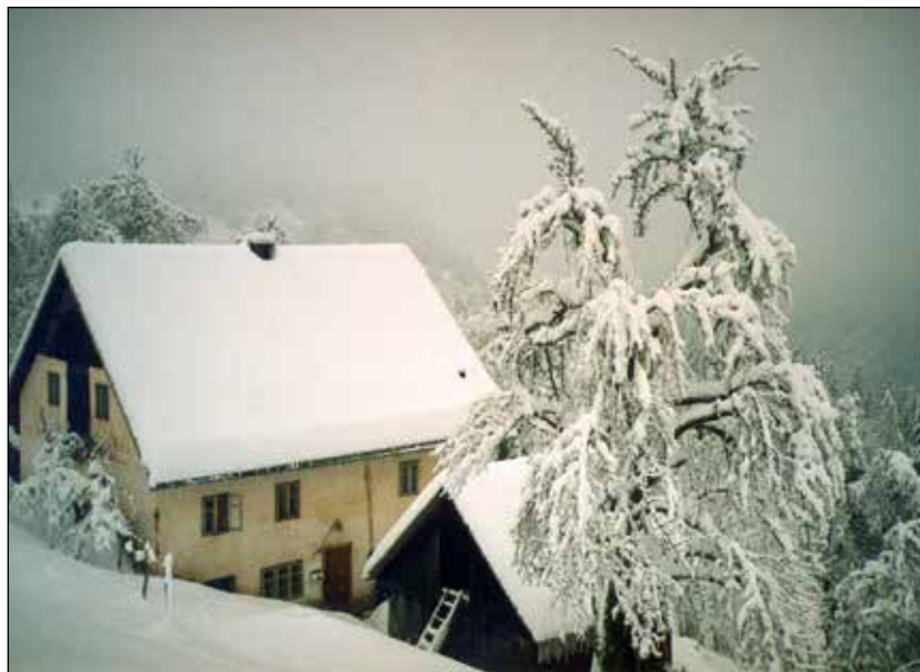
Ojstri Vrh.