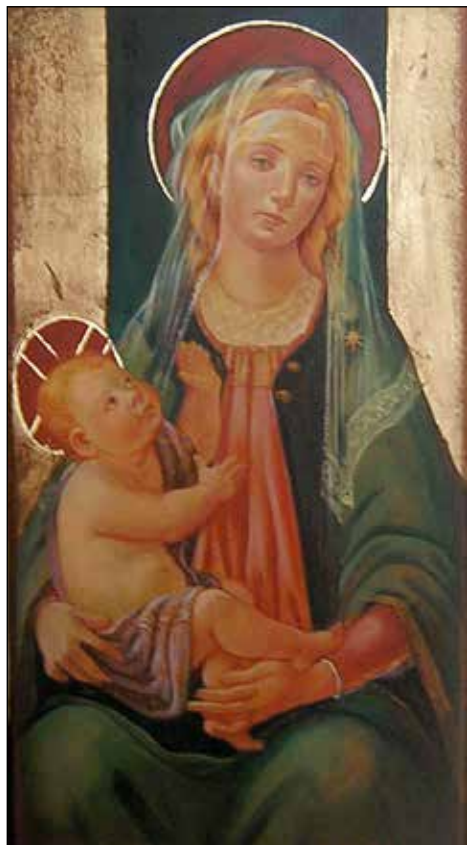
Notranjost bo krasila slika Marija z detetom, ki jo je na les naslikala Maša Bersan - Mašuk.