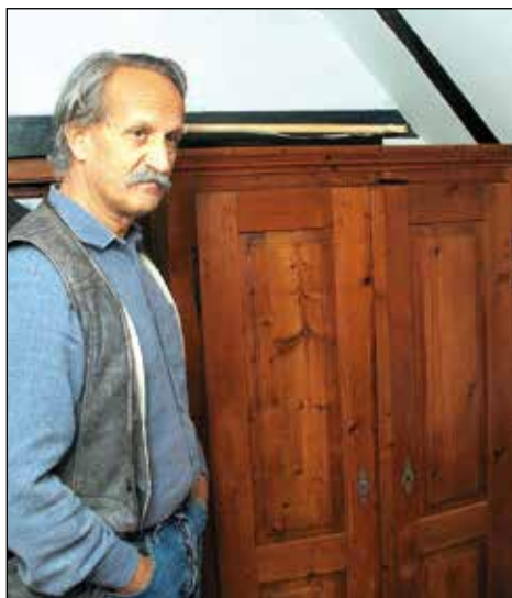
Obnovljena omara.

pogosto prihajali. Bili so t. i. vikendaši, jaz te besede ne maram. Ko me kdo vpraša, če grem na vikend, mu povem, da nimam vikenda, da imam hišo. Vikendaši so danes taki, da pridejo v lep kraj, kjer v glavnem veseljačijo, so hitro prehrupni, hitro onesnažujejo okrog sebe, veliko je alkohola. Vnašajo tudi navade, ki v tako okolje ne sodijo. In ta družina s Štajerske je bila zelo zagreta, da bi hišo dobila, in so me zelo postrani gledali, ko sem se nenadoma pojavil, ampak je potem šlo brez hudih besed. Težko so šli. Vendar so bili tujci, ne bi živeli s hišo. Meni je pa veliko do tega, da ostane hiša, kot je bila. Želim jo samo popraviti, s čimer pa je veliko dela. Vendar imam veliko načrtov, da jo ohranim, da ne bo propadla.