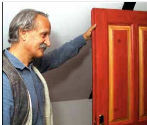
S hišo moraš živeti: obnovljena vrata.