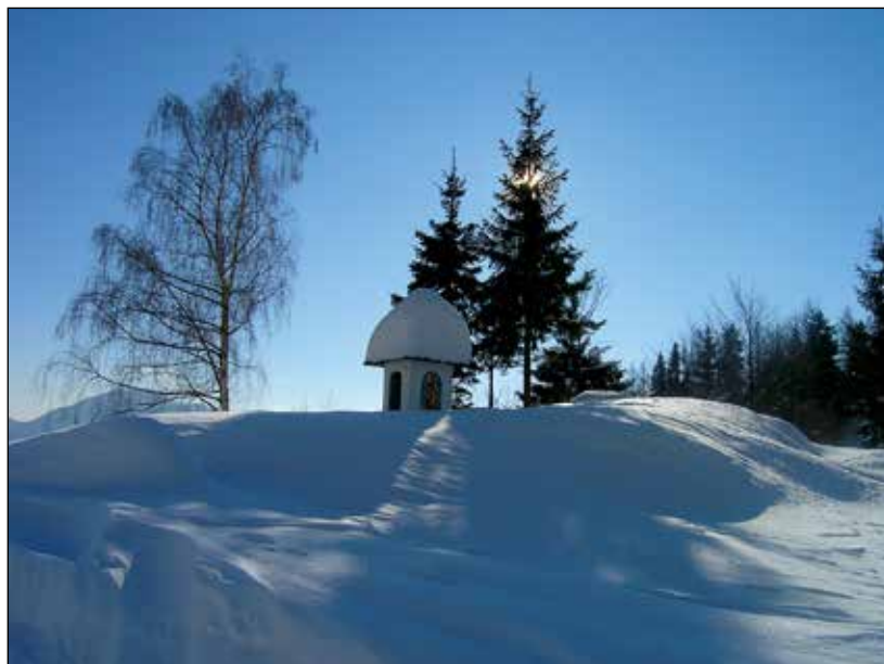
"Pogrešal sem smreke."

dli: Cankar je imel eno dinjo, Tone eno jabolko in jaz eno češpljo. To je bil naš plen. Potem smo šli gledat še film Starec in morje.