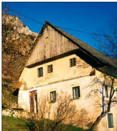
Včasih Boštjanova hiša, danes Janezova.

To je nujno, da odprem hišo, prezračim, posedim, malo zakurim v peč.