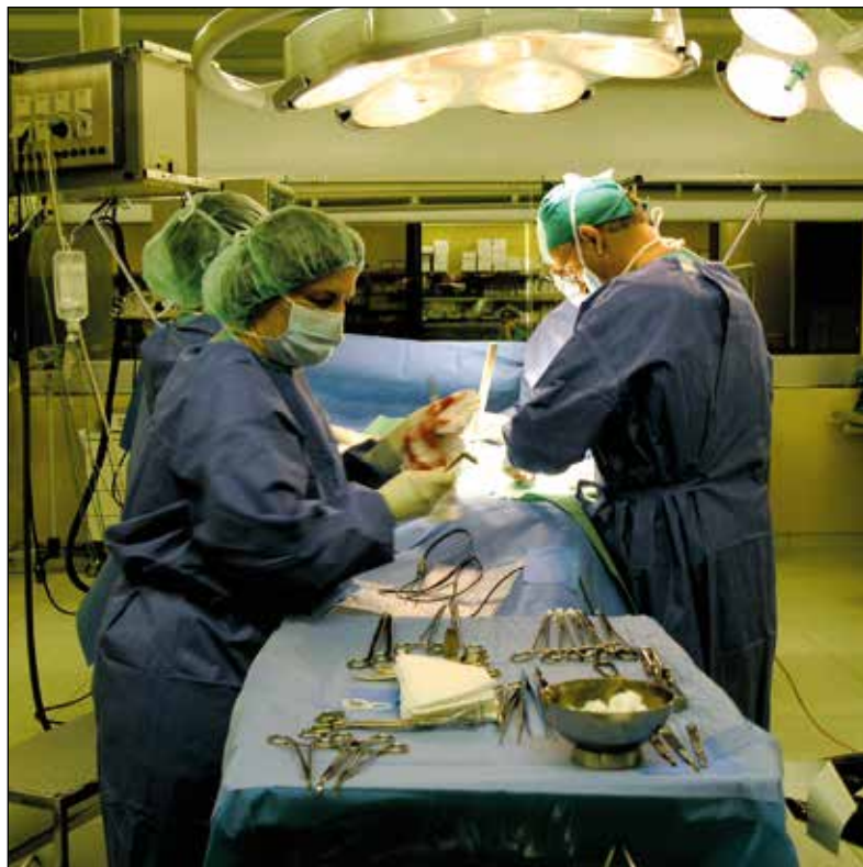
Operacija v prsnem košu.

Z operacijami v prsnem košu. Operiramo vse razen srca in velikih žil, ki spadajo že v drugo področje. Najpomembnejša so pljuča in tudi drugi organi, na