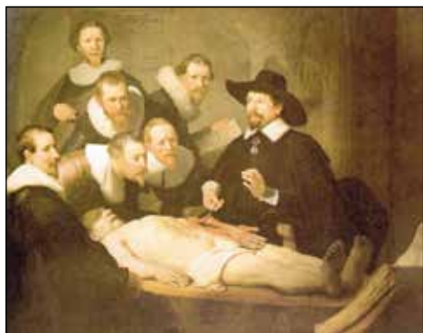
Rembrandt: Anatomija dr. Tulpa, 1632.

vonj kot v vsaki ordinaciji (smeh). Ampak kar me je najbolj presenetilo, je bila slika, ki je visela na nasprotni steni stola, na katerega sem moral sestiti. Gledal sem naravnost v reprodukcijo Rembrandtove slike Anatomija dr. Tulpa (naslov slike sem izvedel kasneje). Slika prikazuje odprto roko (podlaket), tako da se vidijo kite, mišice, žile. Oseba, ki razlaga, je dr. Tulp, ki ima okrog sebe polno učencev, ki drug drugemu gledajo čez rame ... In tista slika me je čisto prevzela. Mislim, da so res bili taki dogodki, ki so vplivali na mojo odločitev. No, vsekakor je slika Anatomija dr. Tulpa name zelo vplivala.