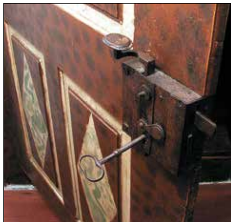
Še vedno se zaklenejo.