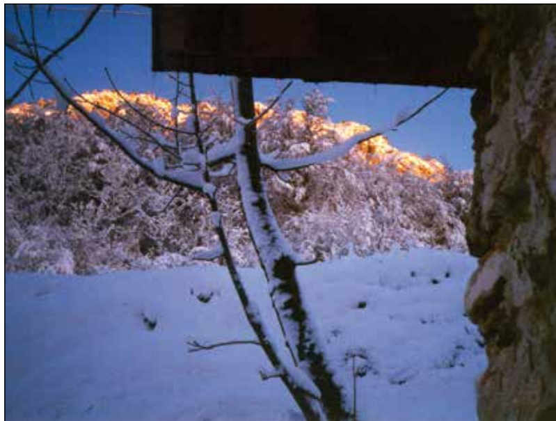
Izza Boštjanove hiše v Zabrdu na turno smuko, gor v kraljestvo sonca in snega.

Tudi dekleta so smučala. Milke se ne spomnim, ker je bila že toliko starejša. Spomnim se Betke, Mici in Jožice, medtem ko mislim, da Anica ni nikoli smuča-