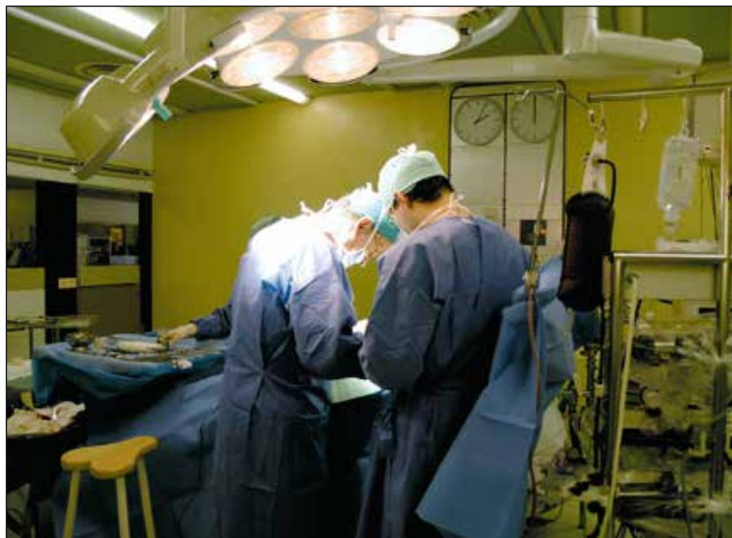
Operacija v prsnem košu.

Bolnik, ki pride na naš oddelek, ima že postavljeno diagnozo in ve se, da se bo bolezen zdravila z operacijo. Včasih sodelujemo tudi že pri diagnozi. Ni pa nujno. Celo bi rekel, da pri diagnozi ne sodelujemo