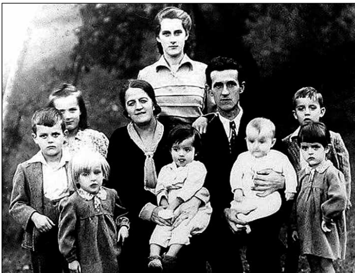
Družina Eržen okrog leta 1950. Foto: arhiv Janeza Eržena.