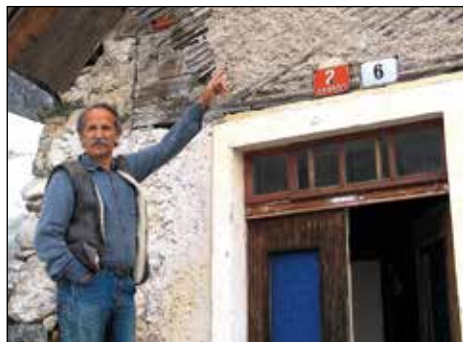
"Hiši bom vrnil njen prvotni videz."

Teta si je zelo očitno oddahnila, ker so bili kandidati za hišo tudi družina s Štajerske, ki so pri njej stanovali oz. jim je stric na vrhu naredil sobico in so zelo