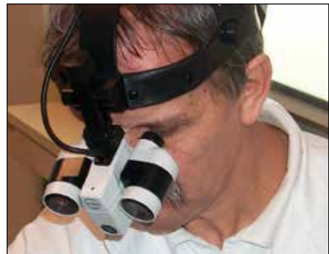
Pri operaciji.

Mi operiramo, kar je za druge specializacije redko, vrat, ščitnico, občitnice in druge manjše posege na vratu, potem vse v prsnem košu, pa še v zgornjem