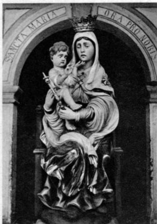
Gorica na Dolenjskem