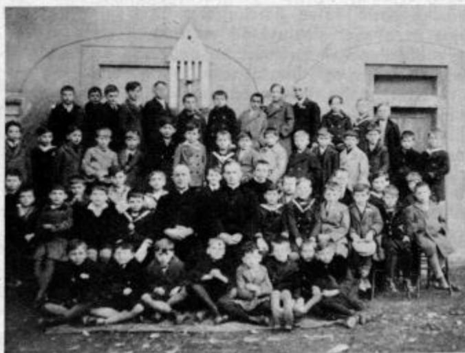
Marijin vrtec v Križankah v Ljubljani