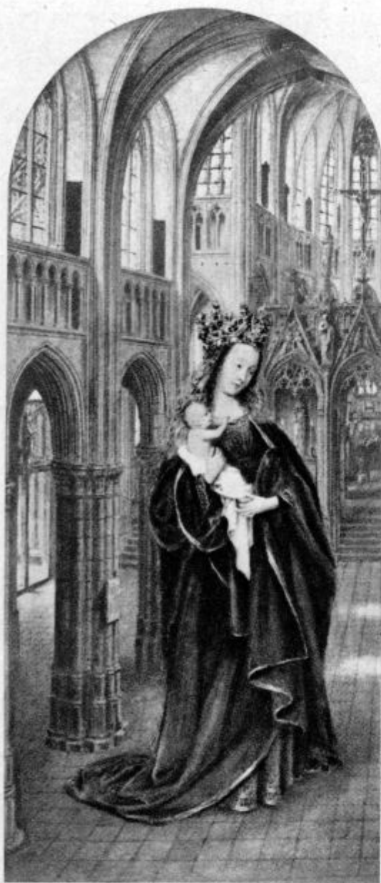
J. van Eyck