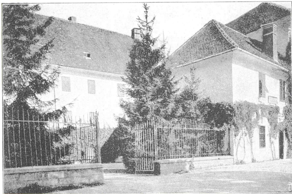
Preddvorski grad s penzijo „Grintovec“.