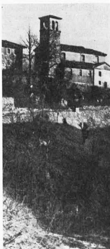
Vizont (Chialminis) s cerkvico

Ko smo se s to «znanko» zapletli v resne pogovore, nas je vprašala: «Vi, ke no živite to u citade, bi znali povjedati, če no majo dirit do medižin vedove od uere brez plačat? Ja san šla tje u Čento anu dali so mi dan tesarin, za tikerega san dala 150 lir anu s tjem so me poslali tu u Uidan. Ta dole so me uprašal, če no man še kajšno kaso anu kar san jala, ke nu man INAM anu «Coltivatori diretti», o me njeso dali nič. Ja o konšumavam skuazej za 10.000 frankov po mjescu za medižine, ke man pouno boli