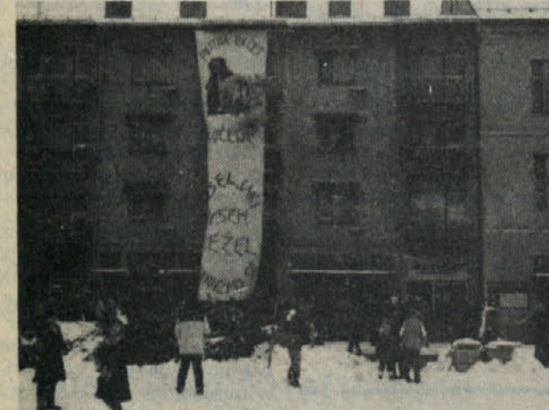
Razen vremena je organizatorjem zagodel tudi veter – napis veseljaki na transparentu je spremenil v seljake