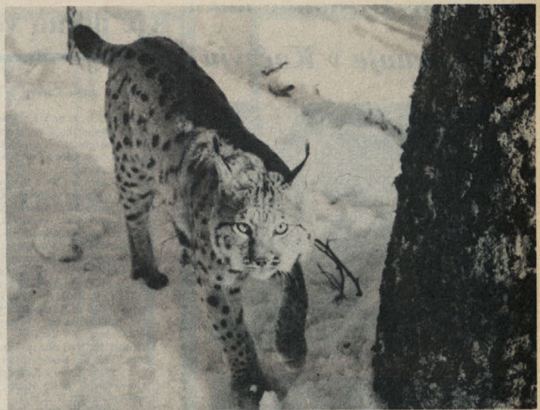
Lepotec Kočevskih gozdov na obhodu