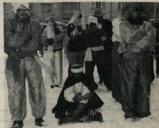
»Turki so Kočevcem ponudili boljše pogoje