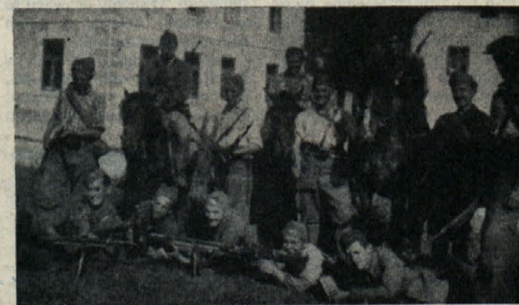
Udarni vod Kočevskega odreda v Koprivniku, maj 1942