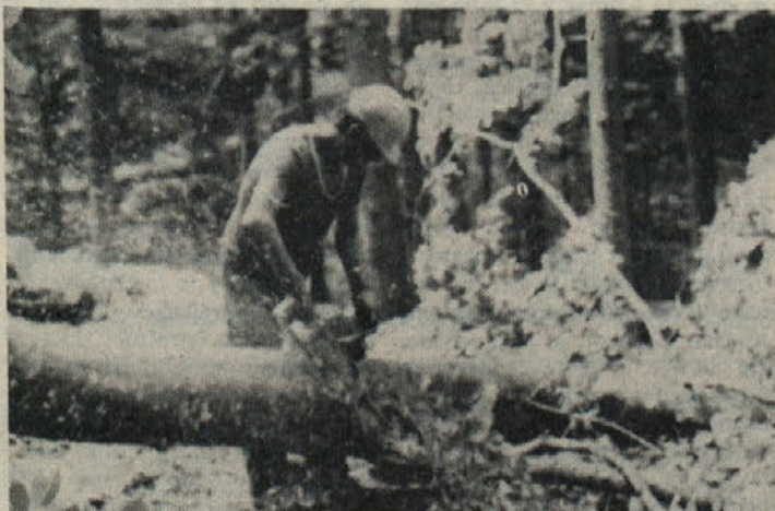
Kleščenje vej z motorno žago