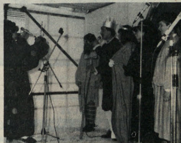
Za prepričevanje množic o pravilnosti vseh ukrepov je tudi dvor uporabil mikrofone