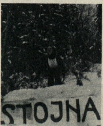
Tov. Koruzar - veteran v smučarskih skokih