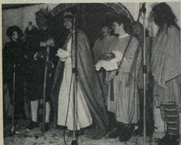
Osrednje osebnosti pustovanja sta bila ženin in nevesta