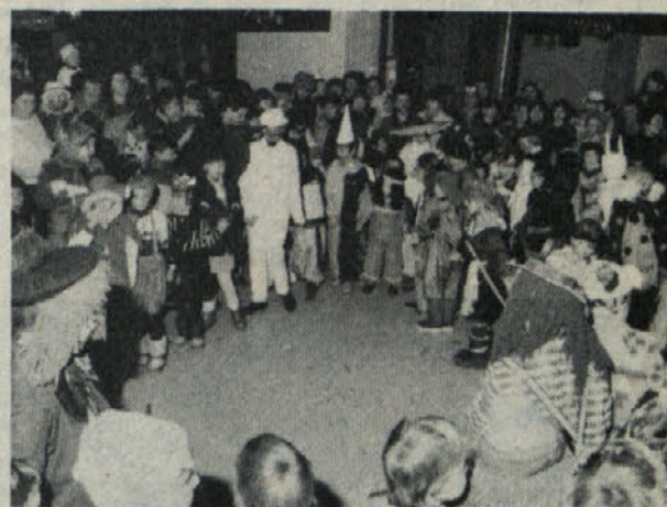
Zabava za najmlajše je bila v prostorih Name