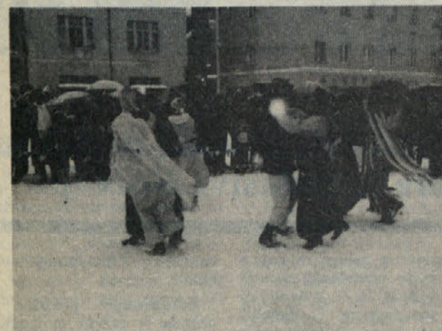
Kljub ideološkim razlikam so našli skupno interesno področje