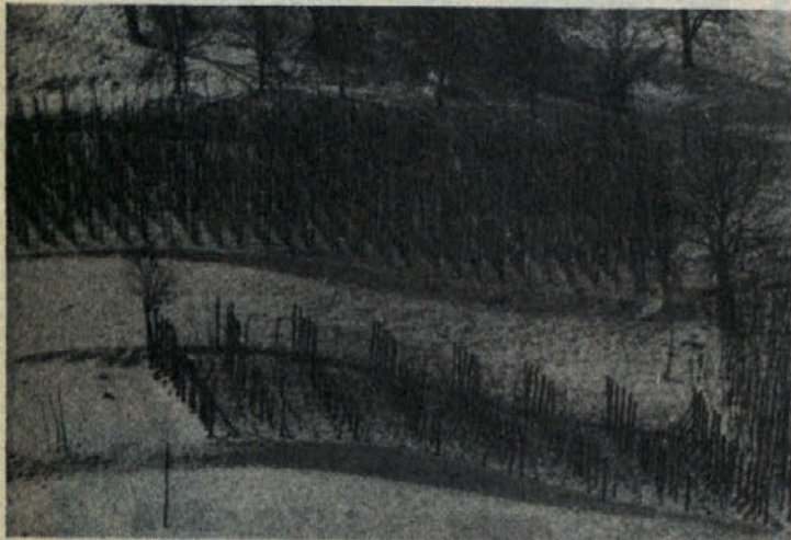
Obkolpski vinograd v zimskem spanju

Prav bi bilo, da bi vzpodbude v zvezi s plesom na Kostelskem prišle tudi s starni folklorne skupine, ki deluje v okviru KUD Kostel. Ta si je v načrtu dela za