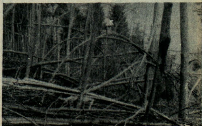
Žled - november 1985