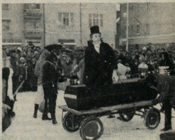
Drakula je ponudil »španovijo« z upravo za dohodke