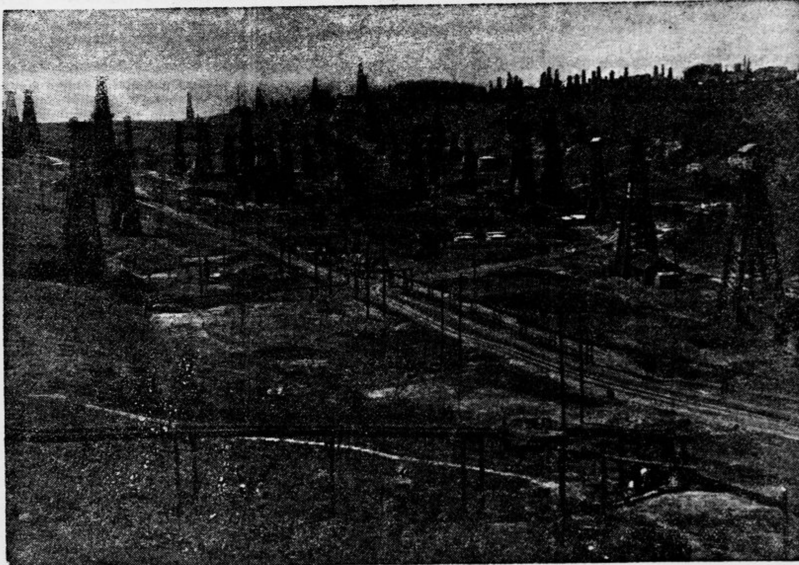
Pogled na petrolejske vrelce v Morenigju