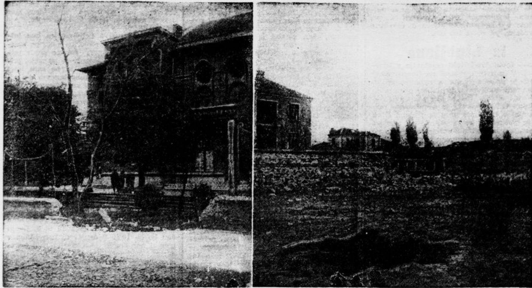
Pogled na Oficirski dom, kjer je bomba porušila zidano ograjo, in na kraj, ki je bil od bomb najbolj prizadet

Deseta smrtna žrtev tuje letalske bombe — Bitoljska občina je doslej prejela 1.200.000 din podpore, kar je premalo za pomoč prizadetim — Po letalskem napadu so mnogi brez zasužka — Zbiranje tujih