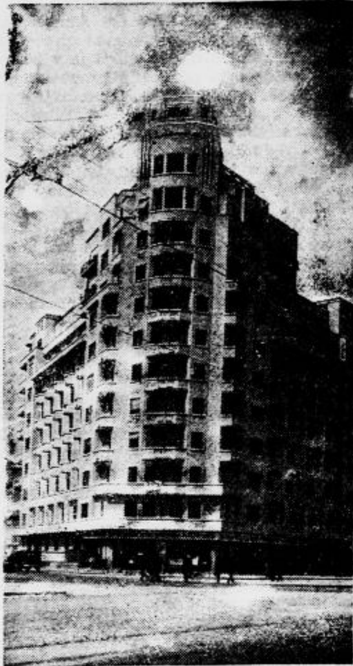
Velika moderna palača »Wilson« v Bukarešti

Kakor poročajo iz Bukarešte, je 183 hiš rumunske prestolnice v nevarnosti, da se vsak čas zrušijo, 402 hiš pa bo nujno treba temeljito obnoviti, če naj ostanejo. Usodno je pri tem zlasti to, da so vse te hiše visoke zgradbe, takozvane bločne palače, visoke 6, 8, 10 in celo 12 nadstropij. Večina teh hiš je last trgovskih družb in zgradbe so nastale skoro vse