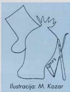
Ilustracija: M. Kozar

Tak bilau. Jančina pejnzi so sfalili pa prišo je domau. Notar ga je dau zgrabiti pa v en