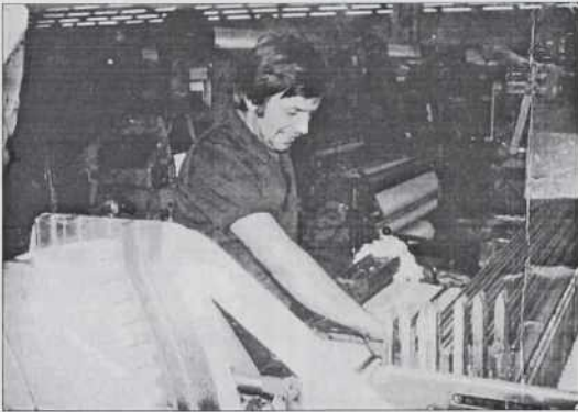
Šantani Ōči, gda je ešče delo

"Ka mo ti gunčo? Gda sam mali bijo, sam dosta mogo krave pa sti. V vesti padašje smo furt vtjup ojdli po gauščaj. Bila je edna drejva, štera je takšna krugiče mejla. Te krugiče smo dole pobrali, smo lüknje napravili pa smo se te z njimi štrkali. Gda smo pa ojdli po svetom posti, te smo k vsakšomi rami šli pa smo prajli, ka: Baug daj sveti post, Baug daj sveti den. Te smo malo pejnez dobili, ka smo si leko čokolado tjüpili. Gda smo pa kokodakat ojdli, te smo drva mogli prinesiti iz üte. Če so nas notra pistili, te smo pri dveraj mogli prkau dole djati pa na prkau poklekni na prajti ka: Kokodak, kokodak, naj vaše kokaüši telko djajce majo, kak na pauti kamenja. Kokodak, kokodak, naj vaše krave telko mleka majo kak v potoki vodé. Pa te so nam tü malo pejnez dali. Istina, ka bilau takšno mesto, ka smo trikrat mogli nazaj titi, ka so nas nej nutra pistili."