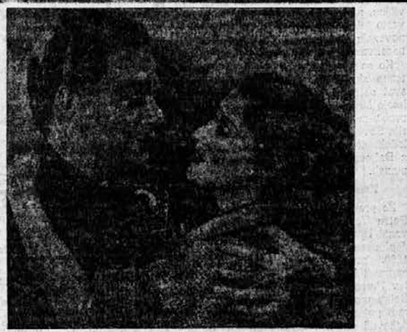
JEANETTE MAC DONALD IN EDDY NELSON, slavna MGM pevca, v filmu »Pesem zlatoga zapada«.

Presušeni mavrahi ali smrčki. — Osnaži jih dobro, a ne peri jih. Prereži jih po dolgem čez pol ali na štiri dele in jih naberi s šivanko na močne niti, ki ne smejo biti predele. Majhne mavrahe lahko pustiš cele. Obesi oziir, priveži te niti na sončnem kraju kakor druge vrvice ali nad šlednik, da se gobe posuše. Ko so popolnoma suhe in trde, jih spravi v vrečico, kozarce ali skatle na suhem, zračnem mestu. Preden uporabljaš mavrahe jih operi, da odstraniš prah in nesnago, popari jih nato z vrelin mlekom ali kropa in jih pokrij, da se namoči. Potem jih ocedi in pripravljaj kakor sveže mavrahe. Prirežaj si mavrahe na zalogo se izplača samo ondi, kjer jih ljudje sami nabirajo in v onih krajih, kjer jih raste posebno mnogo.