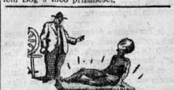
»Ali želi gospod, da mu danes nabrušimo nekaj nožev?«

o Zaradi praznovanja v četrtek ne delajo. V vasi Gornji Brantčiči v takovskem okraju ljudje verujejo, da jih je Bog kaznoval s tem, da jim vsako leto vse pobije. Tako pravi že stara legenda, ki je vsem dobro v spominu. Zato so vsi kmetje te vasi odločili, da ob četrtskih splohi ne bodo delali, češ, da jim bo potem Bog s točo prizanesel.