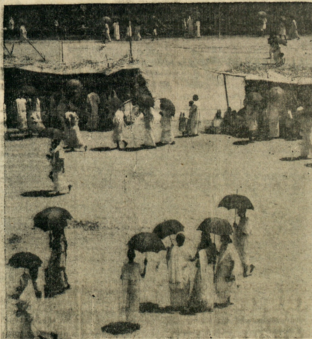
ZIMSKO SONCE V INDIJI — Ko pritiska pri nas mráz in nas sili v tople domove, se morajo Indijci v Maramonu čuvati pred vročim zimskim soncem z — dežniki.

nji čas uredili v svoji cerkvi vaših šesterih pokopališč, pa še iz natrpanega pokopališča, ki je bilo včasih okoli cerkve. Z nami se ti umrli za prijateljstvo božje, v tej cerkvi in župniji darovano in dobljeno zahvaljujejo. — Tem mrtvim se moramo pa tudi mi posebej zahvaliti in zanje moramo moliti v veliki hvaležnosti. Za njihovo verno življenje in za lep krščanski zgled se moramo zahvaliti; posebej zato, da so lepo starotrško župnijo ustanovili, negovali in ljubili. In še posebej, da so hiše božje na tem lepem koščku slovenske zemlje postavljali in tole mogočno farno cerkev ponovno prezidavali, lepšali in ohranili. Našim dragim prednikom priznanje, spoštovanje in zahvala! — Zahvala in vse priznanje pa tudi vam, dragi starotrški farani. Vam, ki ste zvesti potomci svojih prednikov, ki po njihovi trdni veri živite, ki posebej svojo farno cerkev ljubite in zanjo tudi veliko in radi žrtvujete. Pokazali ste to prav v bližnji preteklosti. Zunaj in znotraj ste več cerkva, posebno farno, prenovili in okrasili. Te dni ste pa v duhovni obnovi še svoje duše oprali, da ste se za današnjo slovenskost kar najlepše pripravili. Na ta način boste ohranili slovesne dobre in verne župnije, kar je pri vaših slavni prednikih vedno bila.