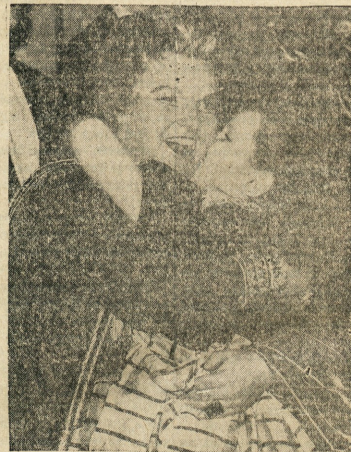
NJEN DAN — Ko je žela Eileen Farrell nedavno v nastopu v Metropolitan operi v New Yorku velik uspeh v naslovni vlogi v "Alcestis," jo je njena hčerka po predstavi navdušeno objela, kot kaže slika. Sreča sije z obeh obrazov.