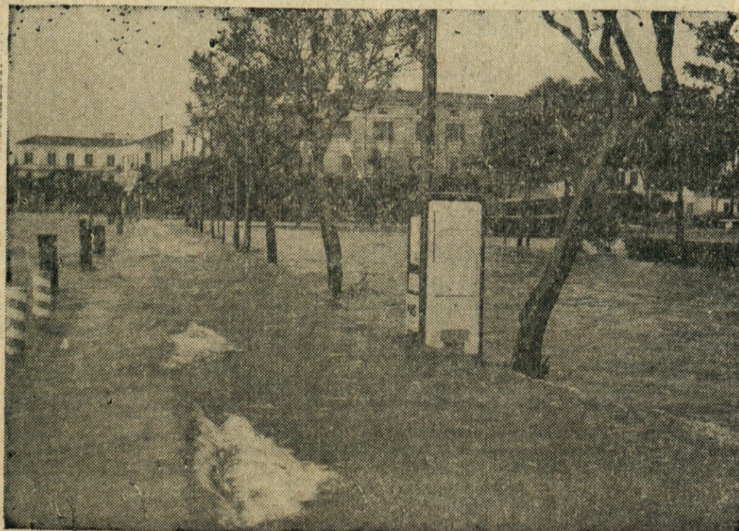
JEZERO UDARILO PREKO BREGOV — Gardsko jezero v severni Italiji je nedavno nepričakovano poraslo, kot ljudje ne pomni jo in preplavilo obrežne predele, kot kaže slika.