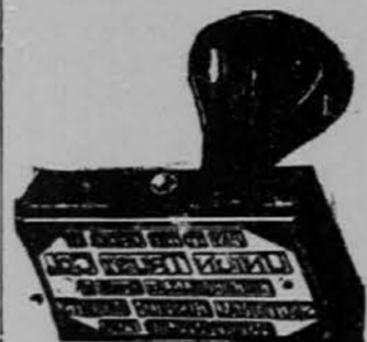
Velika zaloga najnovejših