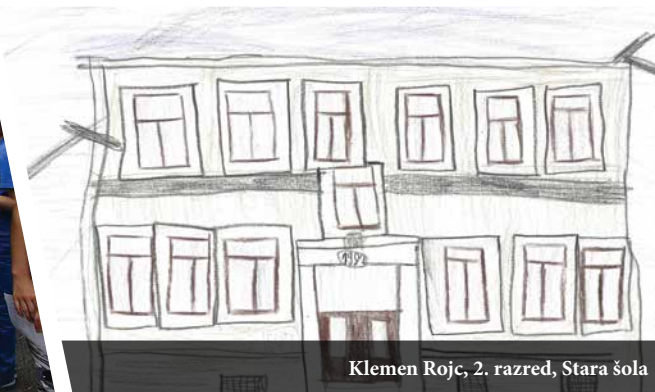
Klemen Rojc, 2. razred, Stara šola