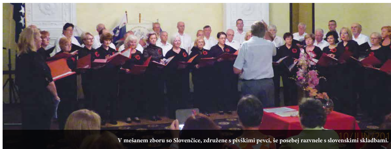
V mešanem zboru so Slovenčice, združene s pivškimi pevci, še posebej razvnele s slovenskimi skladbami.