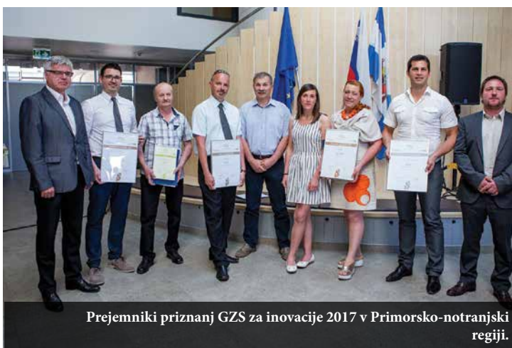
Prejemniki priznanj GZS za inovacije 2017 v Primorsko-notranjski regiji.