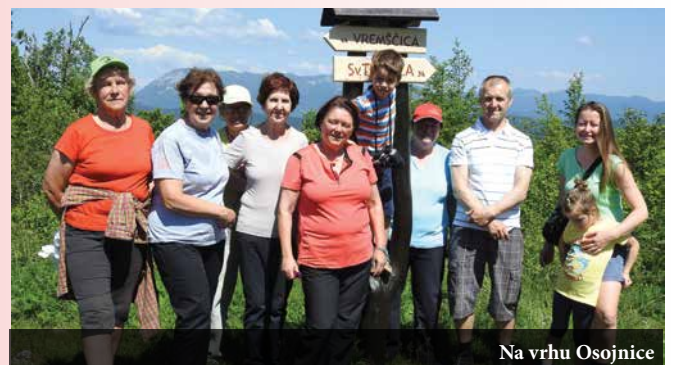
Na vrhu Osojnice