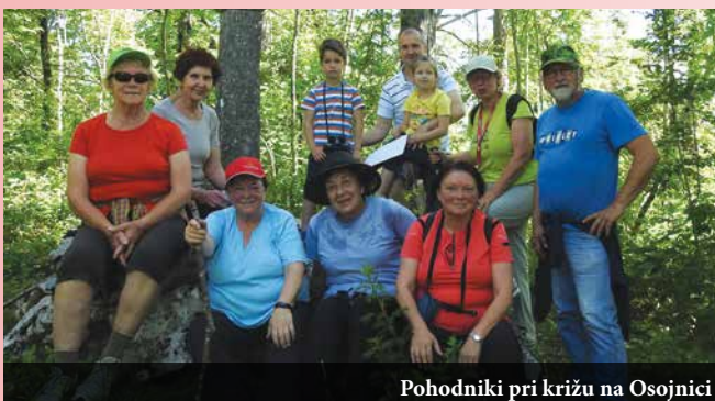
Pohodniki pri križu na Osojnici