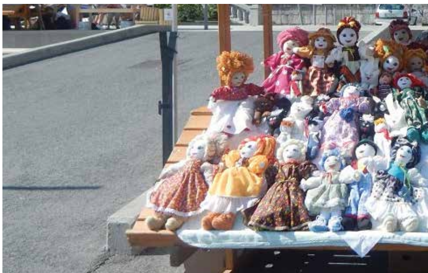
Fotografija je simbolična.