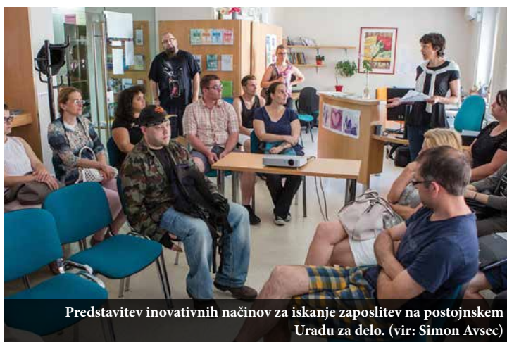
Predstavitve inovativnih načinov za iskanje zaposlitev na postojnskem Uradu za delo.