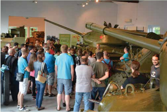
Poletna muzejska noč v Parku vojaške zgodovine.