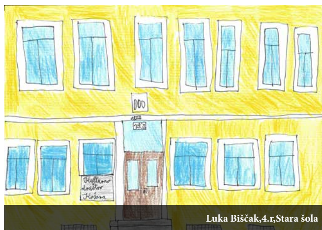
Luka Biščak, 4.r, Stara šola