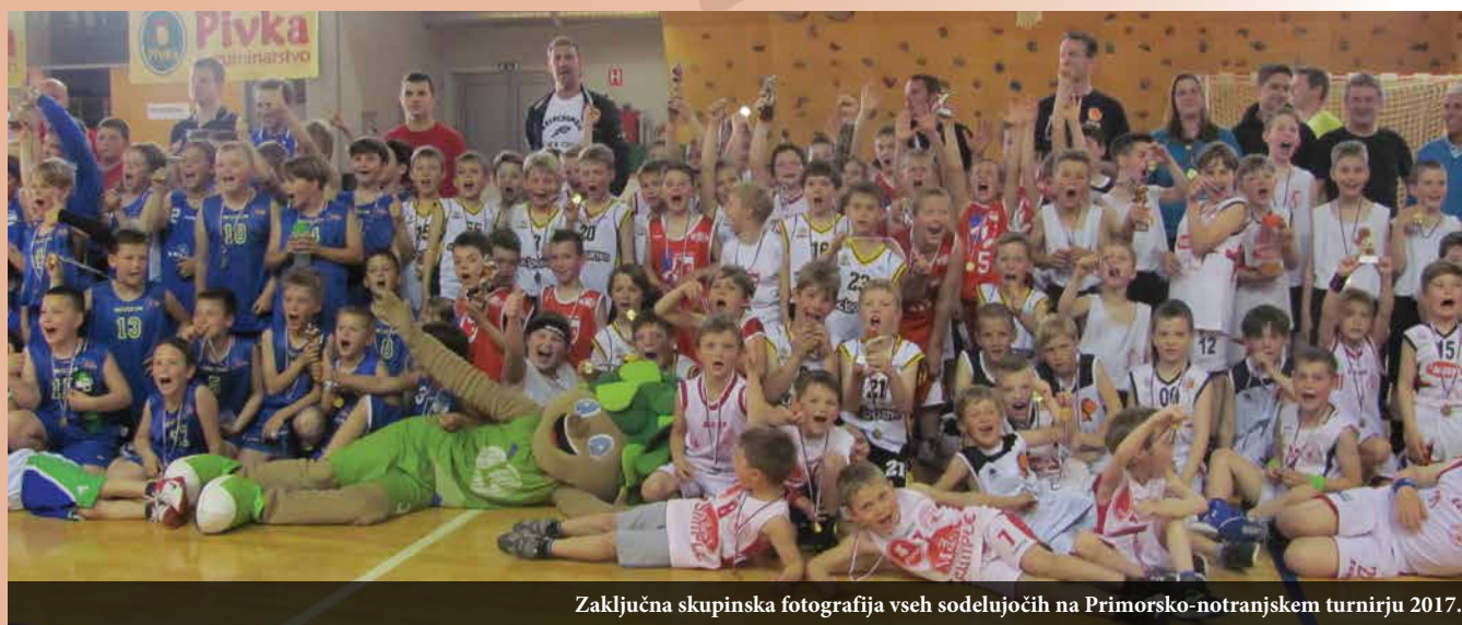
Zaključna skupinska fotografija vseh sodelujočih na Primorsko-notranjskem turnirju 2017.