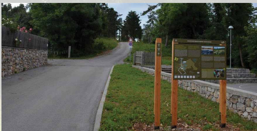
Krajinski park Pivška presihajoča jezera