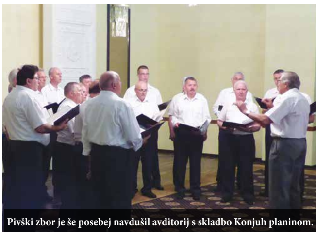
Pivški zbor je še posebej navdušil avditorij s skladbo Konjuh planinom.