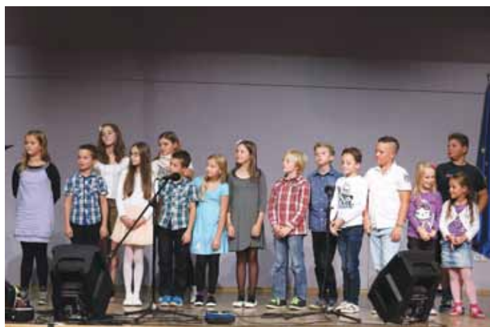
V Volkmerjevemu domu kulture na Destrniku je nastopilo 15 mladih pevcev in pevk iz OŠ Destrnik in Trnovska vas.