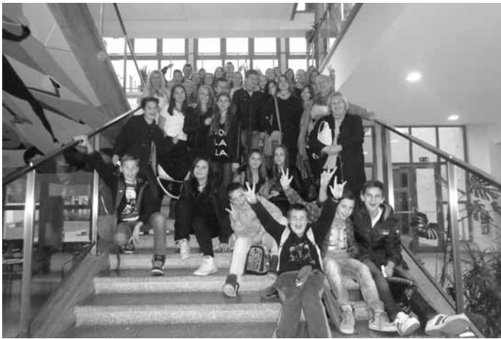
OŠ Destrnik-Trnovska vas