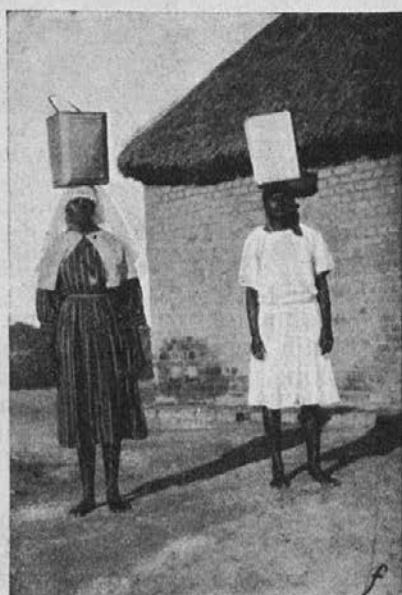
Zamorska sestra s kandidatinjo.

predujem in ga zapravlil, ko hčerka ni bila niti še odrasla. Tako nalete deklice na nepremagljive težave, ko hočejo stopiti v red. Oče jih večkrat tepe, da bi jih pripravil do drugih misli. Marsikatera deklica gre služiti in dela več let, da se more od lastnega očeta odkupiti.