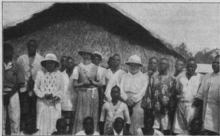
Ubogi gobavi pred svojo cerkvico.