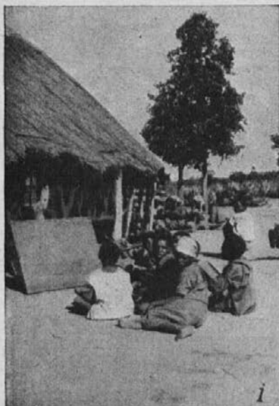
Šola sv. Antona Padovanskega.

V šoli se deklice uče verouk, pedagogiko in metodiko, domačo slovnico, angleščino, računstvo, zgodovino, zemljepis in zdravstvo. Po končanem pouku njih dnevno delo nikakor še ni končano, ker se je treba vaditi v raznih hišnih opravilih. Poglejte na sliki učenke, ki v soboto popoldne pomivajo klopi in mize.