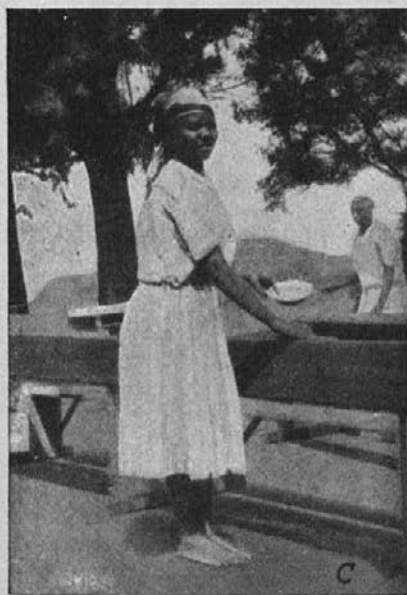
Je sobota, snažimo...