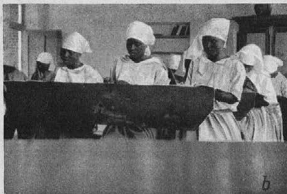
Pri šolski nalogi.