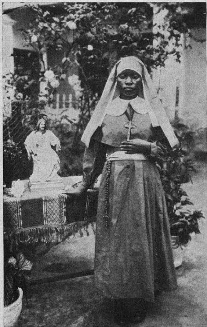
Zamorska deklica — novinka oblatinj Brezmadežne.

Prosim, molite, da se nam načrt posreči in da dobimo kaj dobrotnikov, ki nam bodo pomogli, da odkupimo nekaj deklic.