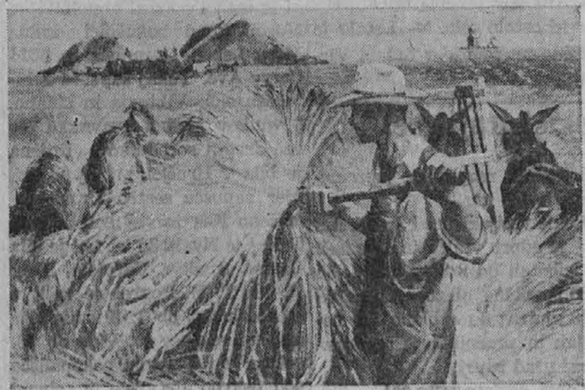
Inaugurating a new lending policy which will make its collection of oil paintings available to other institutions in the United States, the Metropolitan Museum of Art in New York city will begin taking applications for loans on September 1. Typical of the modern American collection is the painting by Joe Jones entitled "Threshing," reproduced above.