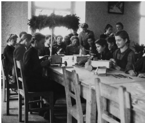
Slika 3: Šolska mladina pri izdelovanju igrač za obdaritev otrok ob božiču v ptujskem okrožju. Fototeka zgodovinskega oddelka Pokrajinskega muzeja Ptuj Ormož.

Prva leta vojne je pouk na šolah potekal nemoteno, od jeseni 1944 dalje pa je bil pouk nereden. Šolske učilnice so občasno zasedli pripadniki nemške vojske in policija. Šolski obisk je bil vsa leta okupacije zadovoljiv; učitelji so učencem grozili, da bodo izseljeni, če ne bodo redno hodili k pouku. Učni uspehi so bili slabi, predvsem zaradi neznanja nemškega jezika, zaradi menjavanja nemškega učiteljstva ter zaradi nekvalificiranih učnih kadrov.