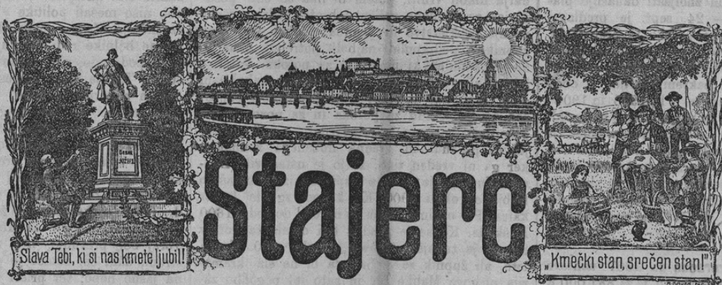
Slava Tebi, ki si nas kmete ljubi!