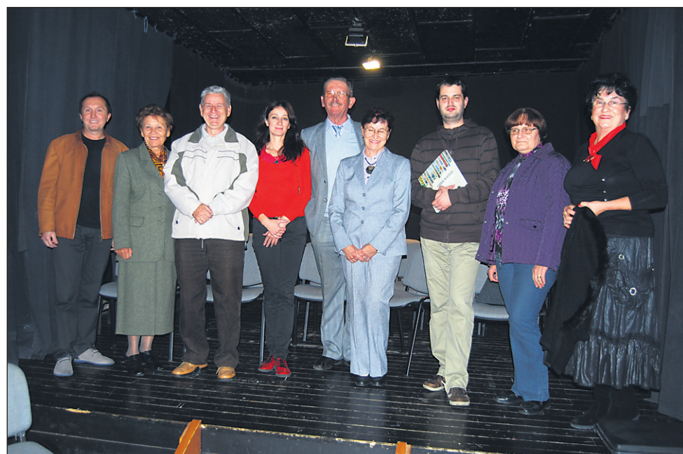
Člani Literarnega kluba Ptuj, ki je praznoval deset let delovanja.