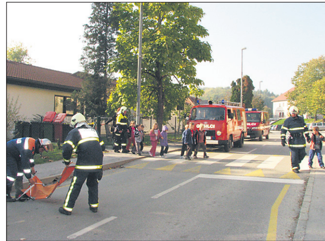
Gasilci so evakuirali tudi vrtec.

Pred kurilno sezono • Dimnikarji opozarjajo