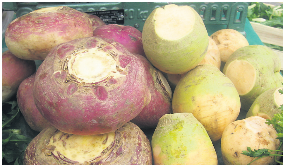
Koleraba in repa sta bili od nekdaj zimsko hrana Slovencev, a za shranjevanje ju ne porežemo zelo v živo.

Vse korenčnice lahko skladiščimo v kletih ali zasipnicah. Kleti morejo biti hladne (0–5 °C), zračna vla-