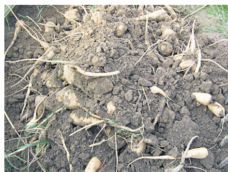
Nalaganje peteršilja in korenja v zasipnico

mraz, pa to zemeljsko pokrivalo dosujete na 20–25 cm. Na enem koncu naj bo zasipnica dostopna tudi pozimi, saj boste iz nje jemali zimski pridelek. Seveda je treba po vsaki uporabi jama spet pokriti. Spomladi, ko se pričneta ozračje in zemlja segrevati, jama odkrijete in uporabite preostale korenčnice. Odlična lokacija za zasipnico je tudi rastlinjak, če imate pozimi v njem kaj prostora.