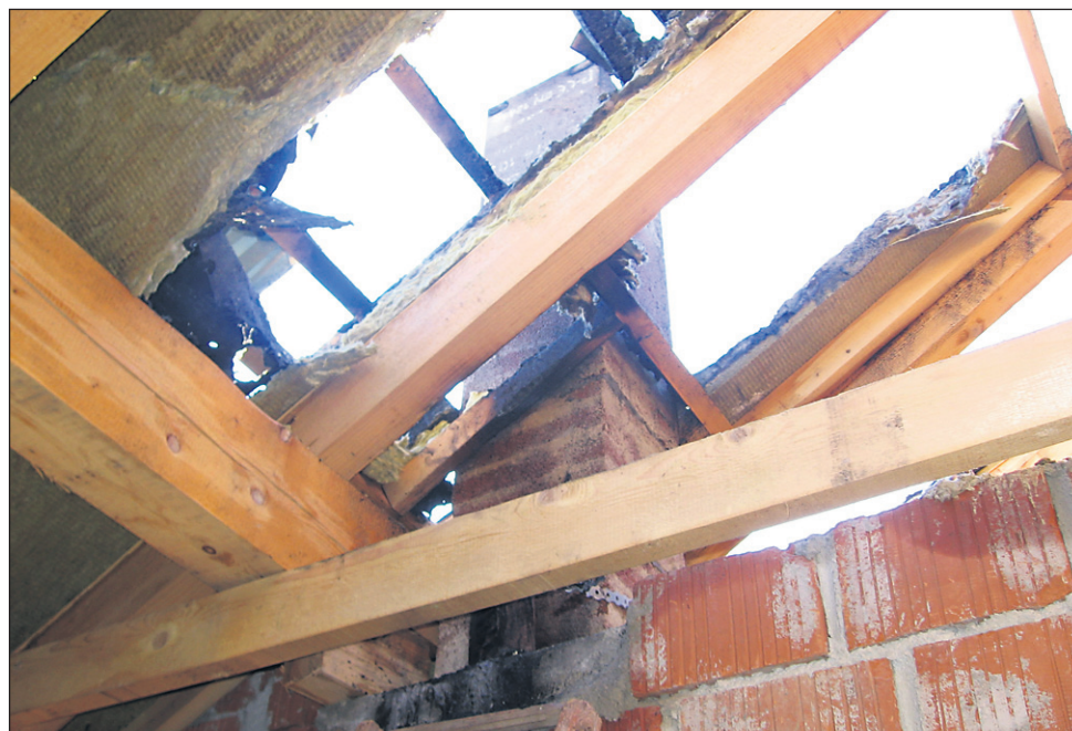
Po požaru ...