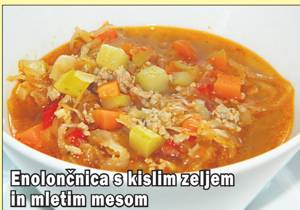
Enolončnica s kislim zeljem in mletim mesom