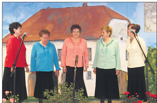
S koncerta KD Ljudskih pevck Jezero, ki so 27. oktobra pripravile koncert ob osmi obletnici uspešnega delovanja.