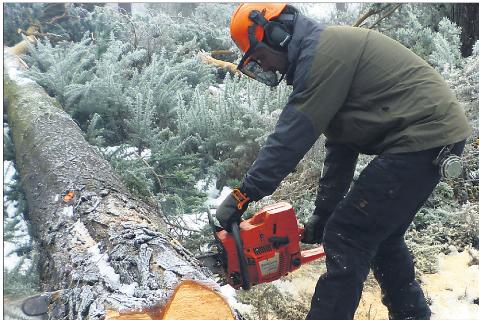
V desetletnem obdobju od leta 2001 do 2011 je pri delu v zasebnih gozdovih umrlo 93 ljudi, v povprečju devet v enem letu, lansko leto pa bilo katastrofalno: uradno je gozdarjenje zahtevalo 21 smrtnih žrtev.

V živahni razpravi med udeleženci okrogle mize je bilo med drugim slišati, da je še vedno premalo usposabljanja in izobraževanja za delo v gozdu, da pa je tudi interes za tovrstne dejavnosti marsikje premajhen oziroma zelo različen po območjih. Razpravljavci so bili mnenja, da bi izobraževanja v okviru RRP morala biti dostopna vsem, ki delajo v gozdu, ne le tistim, ki izpolnjujejo pogoje razpisa, in še, da bi se moral izboljšati sistem subvencioniranja nakupa