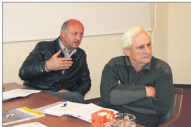
Ormoški lovci skrb za naravo in živali podpirajo, a ne na račun svojega lovišča.

obnovili za ptice in hrošče, želijo jih negovali trajnostno s pašno živino (bivoli), območje pa bodo razglasili za državni naravni rezervat. Čeprav so bile lagune umetno vzpostavljen habitat, so postale pomembno gnezdišče vodnih ptic in selitvena postojanka na jadranski selitveni poti, območje pa se je v preteklosti izkazalo kot eno najpomembnejših za varstvo ptic v Sloveniji