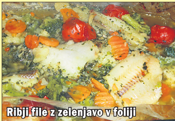
Ribji file z zelenjavo v foliji