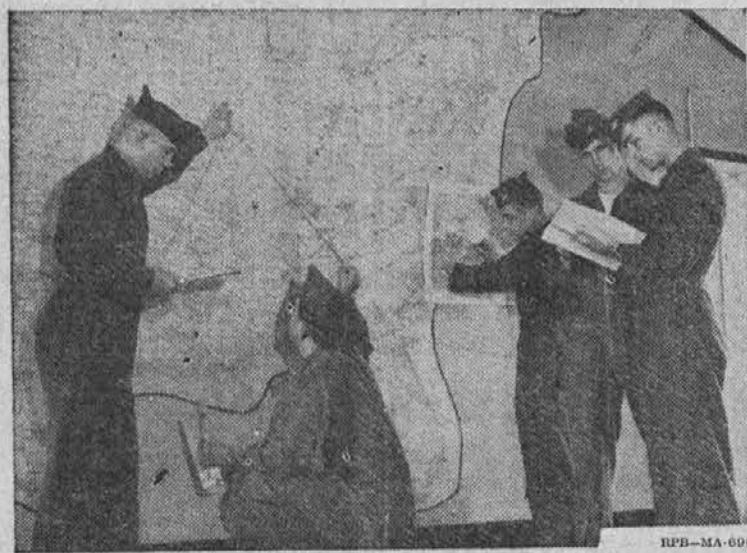
Dressed in flight suits, these Aviation Cadets are shown checking their courses on a wall-size map before take-offs. Young men between the ages of 20 and 26½, single, with 2 years of college (or its equivalent), may now apply for Aviation Cadet training. New classes start every 6 weeks.