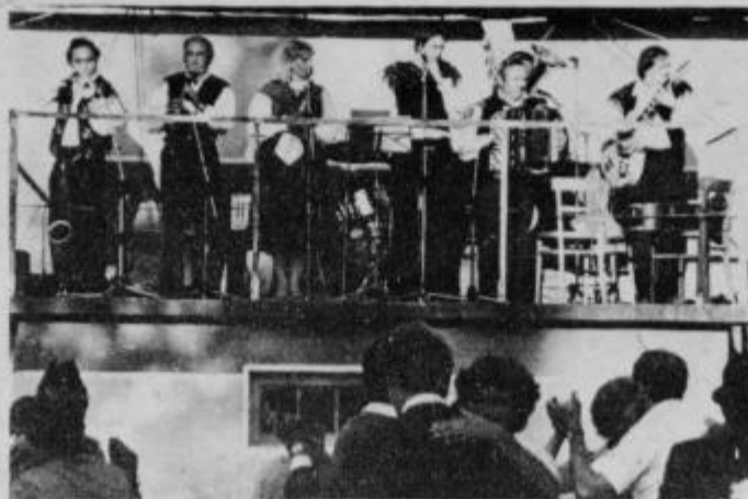
Na prste ene roke bi lahko prešteli boljše ansamble v ptujski občini, eden takih je na posnetku.

Pozdravlja nastopajoče in obiskovalce dvanajstega festivala DZG Ptuj '81.