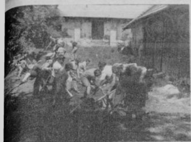
Brigadirji so na udarniškem dnevu krepko vihteli krampe in lopate