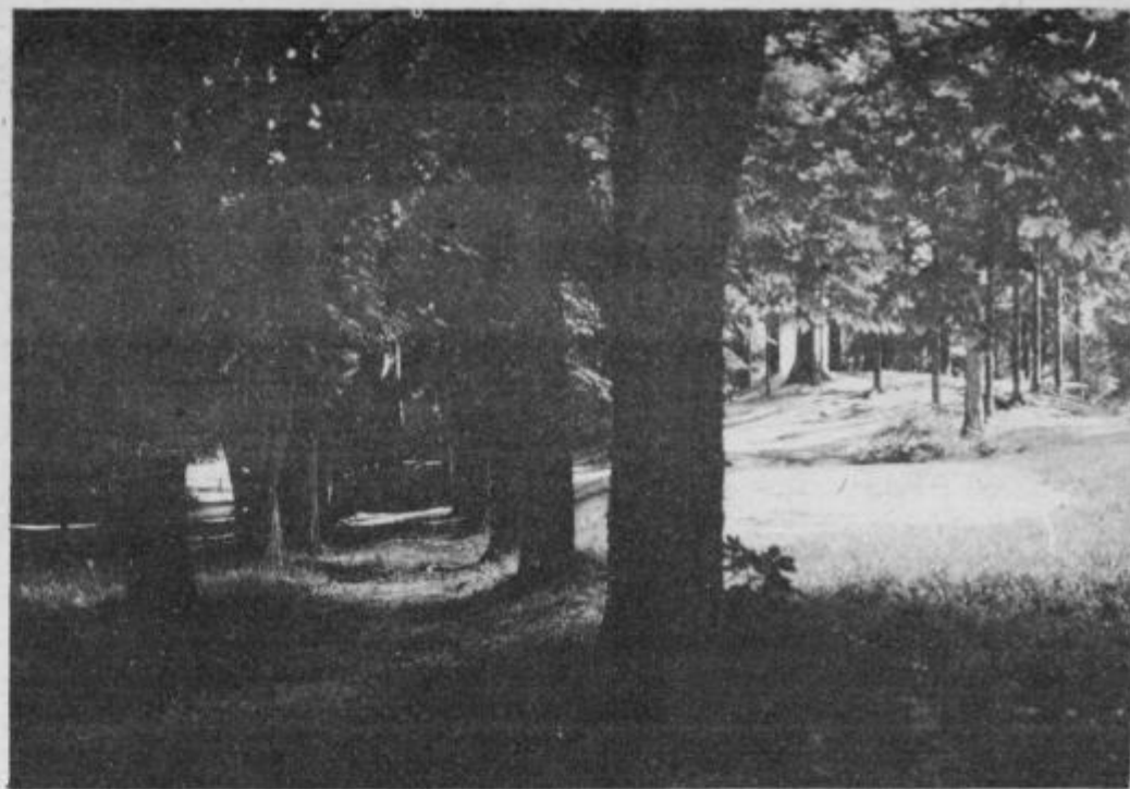
Naj bo pristan s soncem obsijan . . .

Želijo vsem obiskovalcem in izvajalcem dvanajstega festivala domače zabavne glasbe v Ptuj prijetno počutje in kar največ uspeha pri nadaljnjem razvoju te glasbene zvrsti!