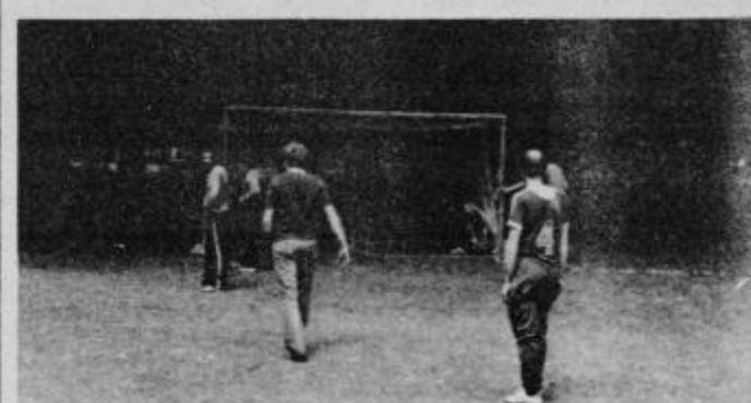
Staro igrišče in mladi pri igranju nogometa.

V sami KS Turnišče se je zadnji čas veliko govorilo o gradnji športnega igrišča in hkrati o postavitvi nekaj objektov za najmlajše prebivalce KS. Kot sem omenil se je veliko govorilo, danes pa je vse skupaj utihnilo. Le mladi se sprašujejo: kako bo kaj z gradnjo? Kdaj in kje bo vse to zgrajeno pa si tudi nihče ni na jasnem. Govor je bil, da se zgradi nekaj takšnega pred samim Domom občanov, kar pa ne ustreza zaradi varnosti otrok, saj je v neposredni bližini zelo prometno križišče cest Ptuj—Hajdina—Videm—Sela. Pri gradu Turnišče pa obstaja velika