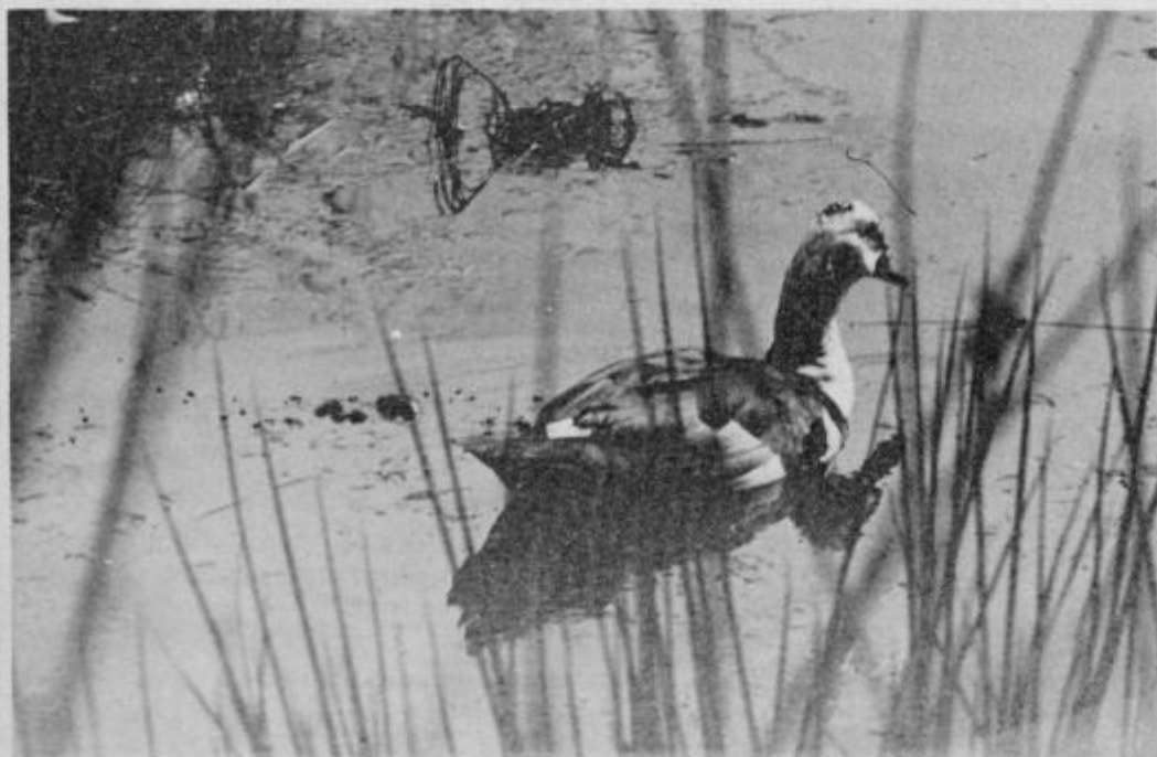
Valovi so pezmi nrmjali.

Vam na XII. festivalu domače zabavne glasbe Slovenije PTUJ '81 želi prijetno počutje in veliko glasbenega užitka.