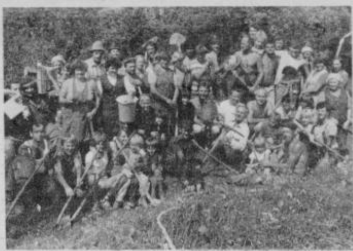
Ob koncu akcije še skupni posnetek članov kluba brigadirjev, mladih z Majskega vrha in domačinov iz Kukave