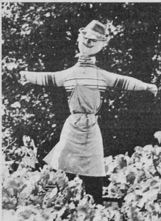
Strašilo med brajdami

VSEM NASTOPAJOČIM ANSAMBLUM, PEVCEM IN OBI- SKOVALCEM PA OBILO USPEHA TER GLASBENEGA UŽITKA.