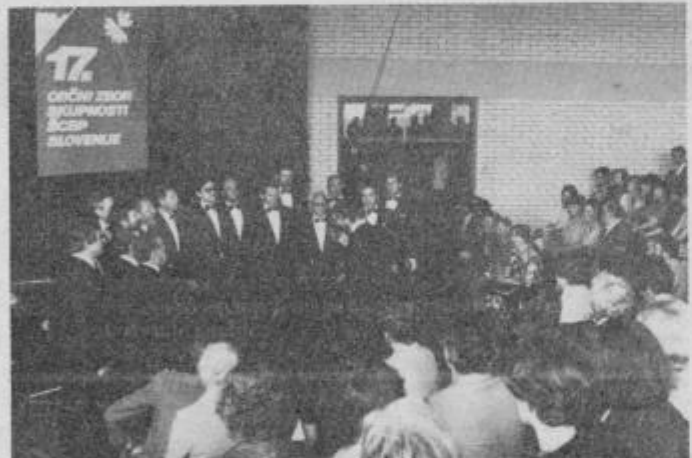
Delovni zbor učiteljev šolskih centrov za blagovni promet