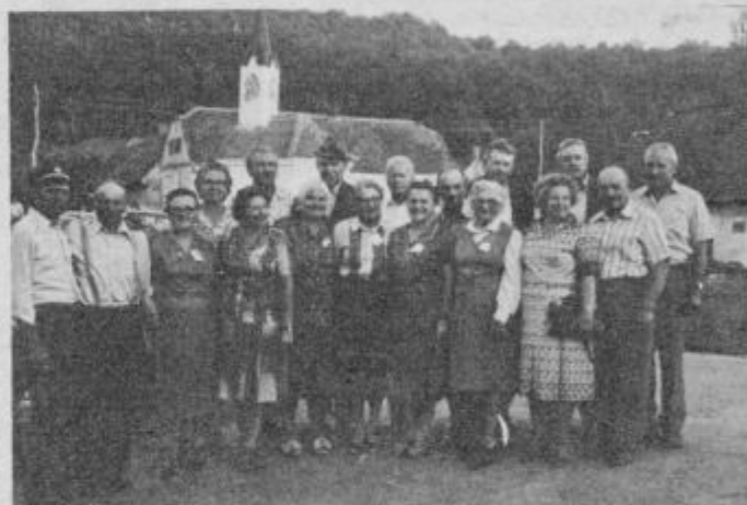
Nekoč fantje in dekleta, danes večinoma že dedki in babice, vendar v srcu še enako mladi kot pred več kot 40 leti, zbrani pri gasilskem domu v Gaberniku