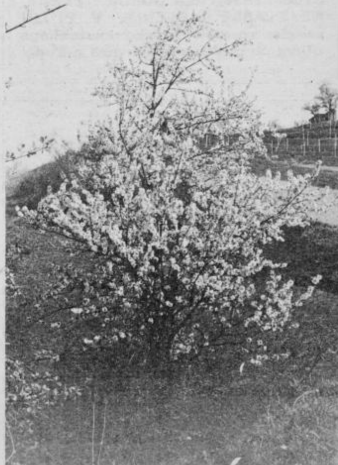
Le pridi spomladi . . .

UDELEŽENCE PTUJSKEGA FESTIVALA PA LEPO POZDRAVLJAJO!