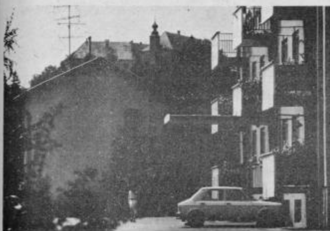
Pod ptujskim gradom glej . . .