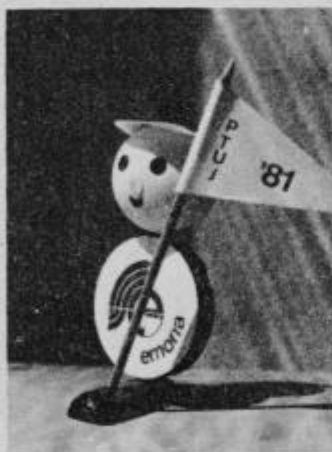
Maskota letošnjih iger