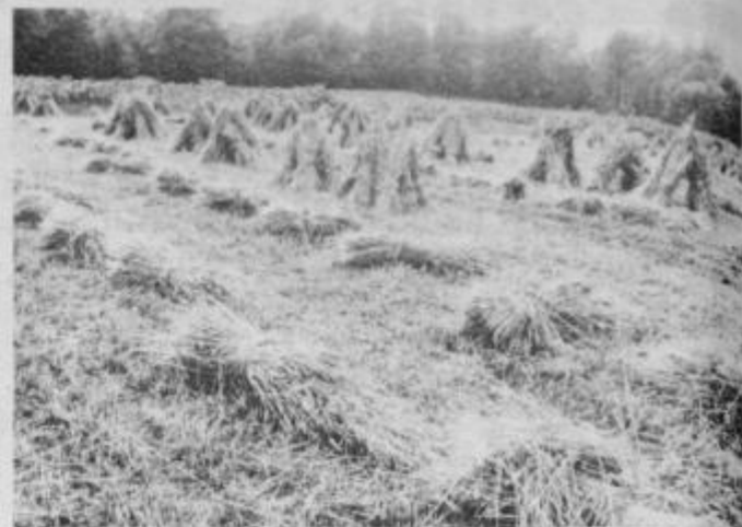
Ob Mōri njive žito rodijo...

splošna montaža elektroinstalacije, vodovoda in centralne kurjave opravljanje servisnih uslug