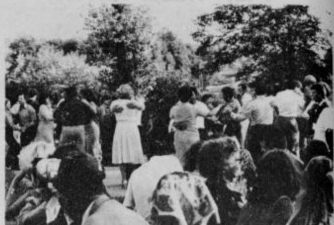
Vse v tem prispevku našeto očitno ne moti plesalcev in drugih „aktivnih“ udeležencev veselice.