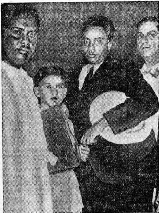
Ras Guksa v Rimu.

Ko je bila mošeja polna do zadnjega kotička. Je imam Sarait z oltarja obrnjen proti Mekki opravil molitve in se zahvalil Allahu, da je rešil vas suše. Komaj je imam opravil svojo zahvalno molitev, že so se kot na povelje dvignili vsi obrazi in hrbiti, ki so bili prej priklonjeni k tlom in sto parov sovražnih oči je strmelo v imama. Imam je stal nekaj časa mirno, nato pa je vprašal: »Čemu me gledate tako divje?« Tedaj so vsi odgovorili kot eden: »Zato, ker govoriš neresnico, imam! Suše nas ni rešil prerok, ampak Bog nevernikov. Vsi sinovi in hčere Allaha se čutimo zato ujaljene in zahtevamo maščevanje.« Imam je počakal, da se je razburjenje pomirilo in je nadaljeval: »Vi hočete maščevanje? Maščujte se torej. Jaz pa, vaš imam, ki sem se učil iz svetih knjig, vam pa povem: Ne samo Bog nevernikov, ampak tudi naš prerok je ukazal: Maščevanje je moje.« — »Naš prerok noče, da bi ostali ne-