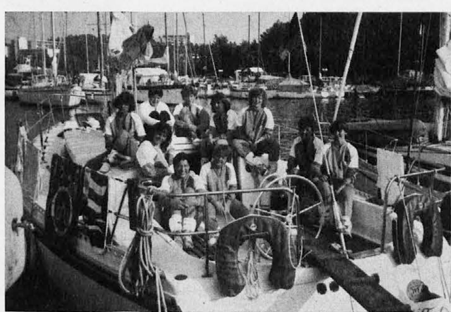
Deklice »Olympie« na jadrnici v Zeleni laguni

Kakor prva moška ekipa Olympije, tako je imela tudi ženska »Under 15« letos delovni počitek. Deklice so preživele teden dni v Zeleni laguni pri Poreču ob kopanju, treniranju in telovadbi po trim stezi. Odi-grale so tudi prijateljsko tekmo s holandskimi sovrstnicami, ki je bila vsem v ve-