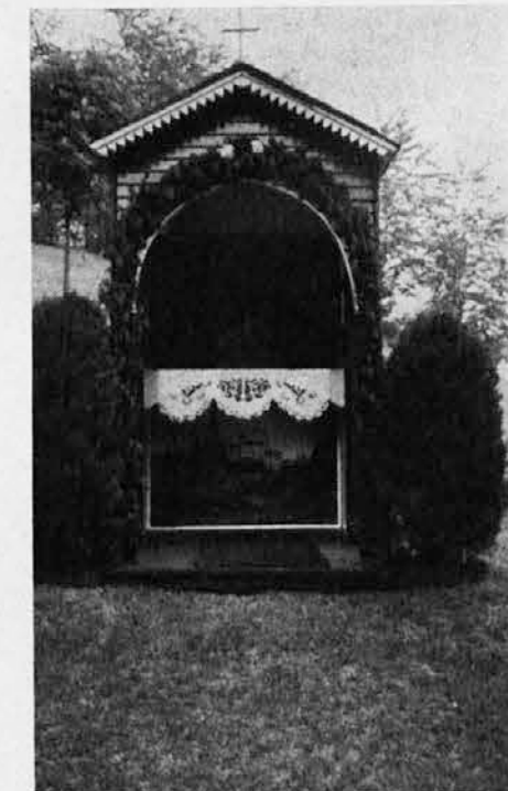
Kapelica s podobo Svetogorske kraljice je pripravljena, da sprejme monštranco z Najsvetejšim na dan telovske procesije na slovenski pristavi v Torontu