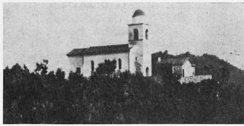
Romarska božja pot Mengore na Tolminskem

Kot je poročala »Družina«, so prenovili Marijino romarsko cerkev na Mengorah. Prenovitev zunaj in znotraj je delo domačinov iz Volč ter iz sosednjih župnij Sv. Lucije (Most) in iz Tolmina. Mengore so namreč grič, ki meji na omenjene tri župnije in Marijina cerkev je nekako last vseh treh župnij, čeprav Mengore uradno spadajo pod Volče.