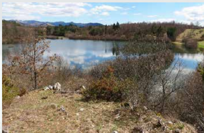
Jezero ob veliki ojezeritvi, v vznožju pobočja (v ospredju) je ponorna jama.