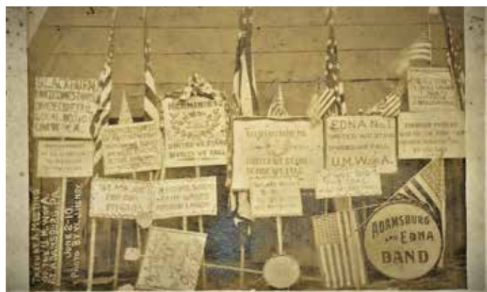
Zahteve rudarjev na zborovanju v Adamsburgu (ZDA)