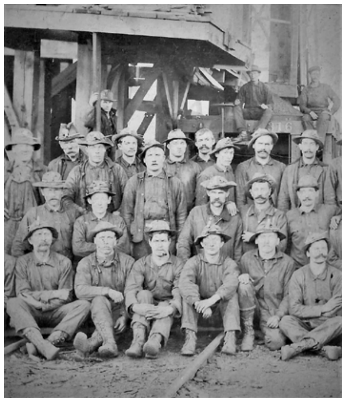
Skupina rudarjev iz Adamsburga (1910)