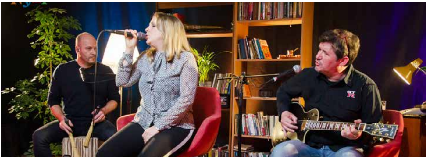
Klub študentov občin Postojna in Pivka

Med izvajanjem projektov in urejanjem birokracije pa KŠOPP še vedno išče nove mlade moči – nove aktiviste, ki bi pomagali pri izvajanju prihajajočih projektov, hkrati pa lahko brezplačno pridobijo nove izkušnje, ki jim bodo lahko pomagale pri iskanju službe v prihodnosti. Bistveno je, da se imamo lepo in spodbujamo druženje in socializacijo mladih =)