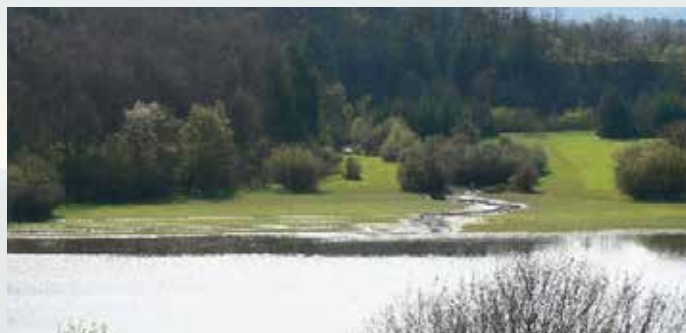
Jezero, ki narašča po vijugah potoka.