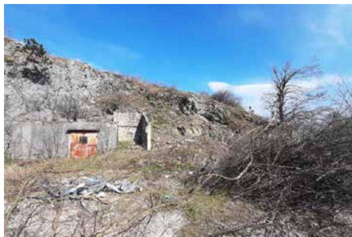
začetek del stopnišče Habjanov hrib