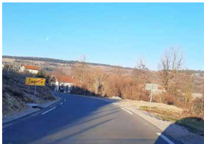
obrnjen prometni znak Zagorje