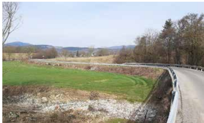
obsekovanje CPK most Stara-Nova Sušica