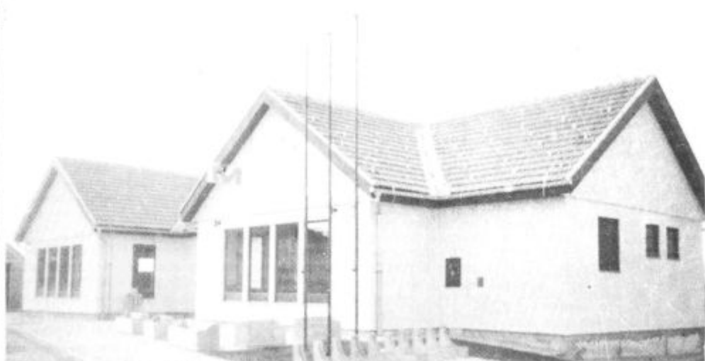
Nova trgovina v Cerkvenjaku pričakuje potrošnike

V mesecu decembru smo asfaltirali še zadnja dva kilometra makadamske regionalne ceste Senarska — Brengova s sredstvi Republiške cestne skupnosti.