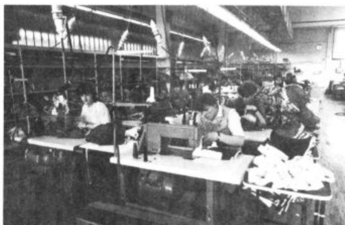
PIK Lenart: Prihodnost gradijo na strokovnih in sposobnih kadrih