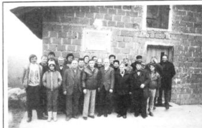
Cerkvenjaški čebelarji pred svojim domom