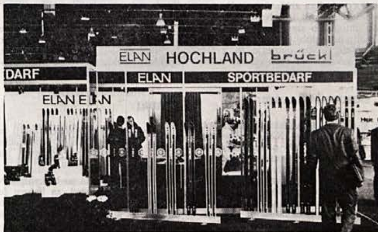
Naš švicarski zastopnik razstavlja v Zürichu

Ugotovljeno je bilo, da se tekmovalno in zlasti turistično smučanje v Jugoslaviji hitro širi. Predvsem severozahodni del države že spada med najrazvitejše predele Evrope. Poglavitni delež v tem razvoju ima uspešna domača proizvodnja smuči. Predvsem Elan, tovarna športnega orodja v Begunjah, je postala po ob-