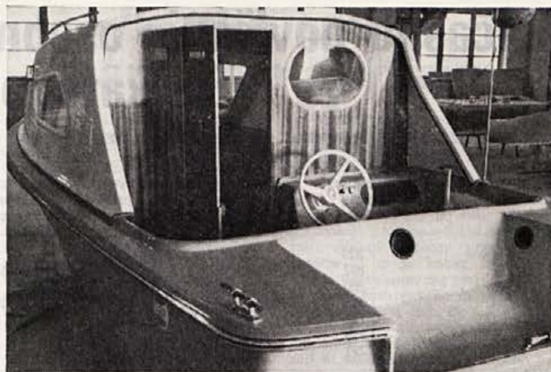
Novo, primerno za letovanje

V programu so aktivno določena finančna sredstva kakor tudi posamezniki — nosilci teh nalog.