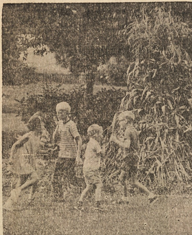
JESENSKA IDILA — Poljski pridelki so pospravljeni, buče je dosegla že prva slana, vendar vabi indijsko poletje otroke še vedno sonce v jesensko prirodu.