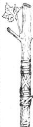
Pod. 31. Zeleno trtno cepljenje v sklad med členoma.

Pogrešek pri krmljenju prešičev. — Pri nas se navadno premalo pazi pri krmljenju prascev, zato seveda ni pravega uspeha. Navadno se krmijo prešiči s kuhinjskimi in mlečnimi odpadki, osobito s pomijami in posnetim mlekom. Tem se doda kuhan krompir ali repa in nekoliko otrobov ali zrnja. Velik in jako navaden pogrešek je pa, da se da živež prešičem preveč stanjšan z vodo. Živali morajo požreti jako veliko množino piče, da dobe dovoljno množino suhih tvarin. Tak živež ni treba svinjam žvečiti, zato se odceja le malo slin in škrob v krompirju in zrnju se radi tega ne prebavi popolnoma.