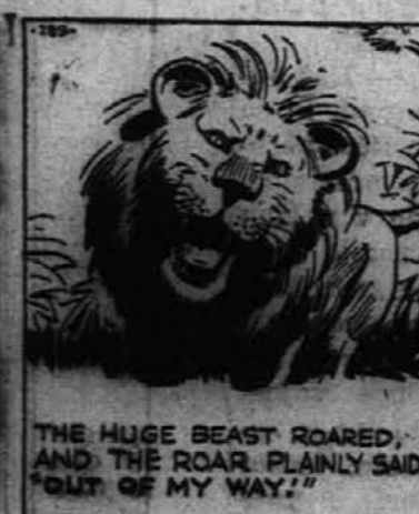
Velika zverina je rjovel, kot da je s tem rjovenjem hustela reči: "Spota se mi spravit!"