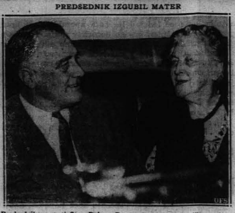
Predsednikova mati Sara Delano Roosevelt, ki jo kaže slika z njenim sinom, je preminula pred dobrim tednom na svojem posestvu v Hyde Park, N. Y. Ženska bi obhajala svoj 87. rojstni dan 21. septembra.