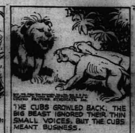
Mladiči so pa rjoveče odgovarjali. Velika zver je njihovo rjovenje prezirala, toda mladčiča sta menila resno.