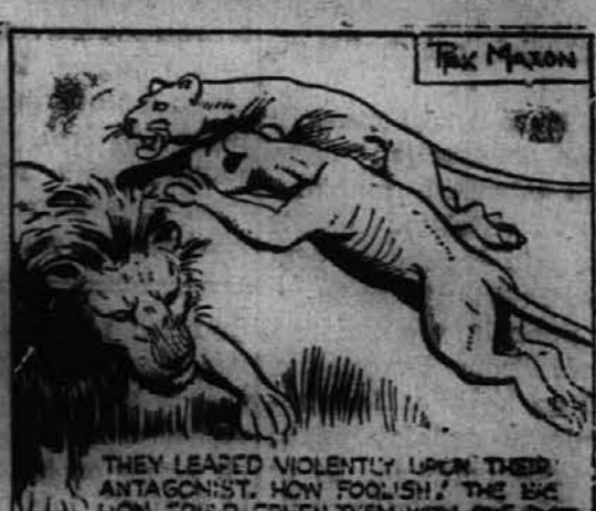
Nasilno sta se v skoku pogrnala na svojega nasprotnika. Neumnost! Veliki lev bi z enim mahom oba zdrobil.