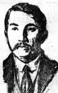
Gilles Marcel Cachin.

Liberté« je objavila Zinovjevo pismo, naslovljeno na voditelja francoskih komunistov Cachina. V pismu naroča Zinovjev v imenu Komunistične internacionalne, da prične francoski komunisti obširno boljševiško propagando posebno v severnoafriških kolonijah. Francoskim komunistom se v to svrhu nakaže podpora poldrugi milijon frankov. Komunistični list »Humanité« je demontiral avtentičnost Zinovjevga pisma, naker je »Liberté« pozval Cachina naj vložiti tožbo. »Liberté« pravi, da ima dokaz za svoje trditve. Afera s komunističnimi milijoni je vzbudila v Franciji veliko senzacijo. Kakor se vidi, so ruski komunisti še vedno prepričani o možnosti »svetovne revolucije« in imajo za svoje utopiščne politične predstave milijonske vsote na razpolago...!