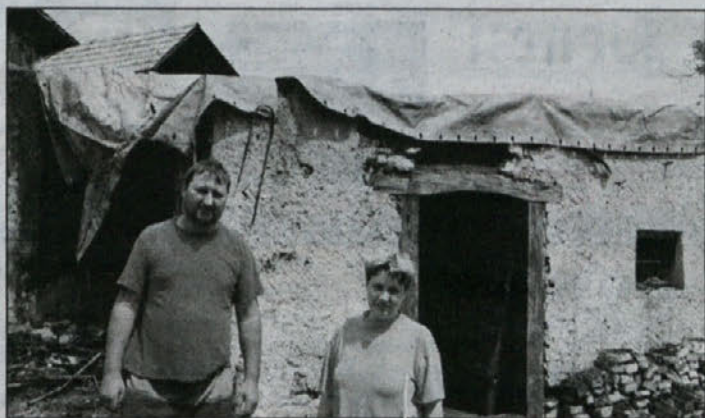
Nesrečna zakonca Mislaj na pogorišču, ki so ga sosedje že pomagali pospraviti.

Oba imata obilo pohvalnih besed za gasilce in za sosedo, ki so takoj naslednji dan pomagali pri čiščenju in odvozu uničenega