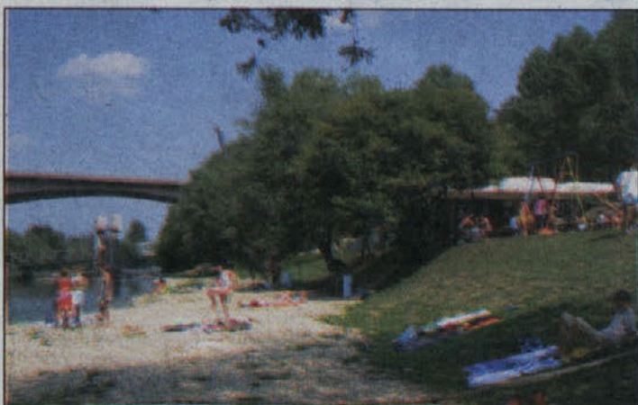
Plaža na Griču, ki jo obiskujejo domačini, družine in mladi, ob koncih tedna pa Zagrebčani in tujci iz Term Čatež.

Sevniški bazen pod upravljanjem Komunale letos za kopalce ohranja lanske cene vstopnic. Dnevna karta za odrasle je 50 SIT cenejša od brestaniških sosedov. Čeprav voda ni ogrevana, je njena povprečna temperatura 27 Celzijevih stopinj. Poleg 550 prodanih sezonskih kart dnevno prodajo še od 200 do 250 vstopnic in dnevno se namaka do 400 kopalcev.