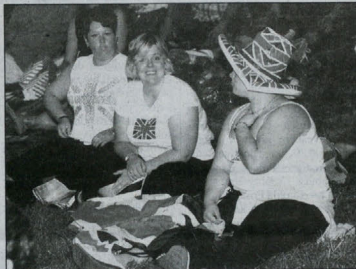
... in "bujen" šopek angleških navijačic.