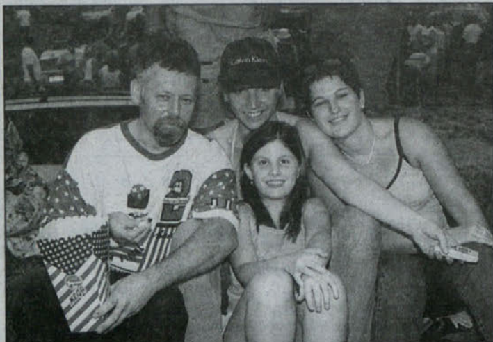
Zadovoljen domači navijač s šopkom posavskih mladenk...