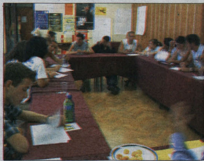
Mladi na eni od delavnic