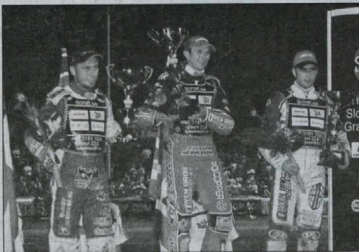
Zmagovalna trojica krške Grand prix dirke: tretje uvrščeni Britanec Scott Nicholls, zmagovalec Avstralec Leigh Adams in drugi Danec Nicki Pedersen.