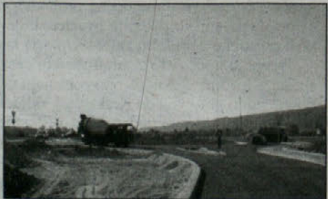
Krožišče še ni dokončano, vendar se promet že lažje odvija.

Trnje – Krožišče v Trnju je končno dobilo asfaltno prevleko. Izvajalci imajo po pogodbi do konca septembra še čas, da ga povsem dokončajo. Projekt vodi Ministrstvo za promet oziroma Družba RS za ceste, ki prispeva 88 milijonov SIT, obveznosti občine Brežice so 28,5 milijona SIT. Občina je ob gradnji opozorila, da je projektant robnike postavil na obstoječ rob starega asfalta, kar je bilo občutno premalo za večja vozila. Dosegli so, da so razširili vozišče v smeri Dobove ter v smeri pokopališča, zmanjšali premer notranjega kroga in tako dobili dodaten prostor. Glede financiranja teh popravkov še ni dogovora, saj so izvajalci morali rušiti in popravljati robnike, občina pa meni, da je to napaka projektanta in da niso dolžni kriti teh dodatnih del. Neizpolnjena ostaja še zahteva občine, da na širino dosežanih pločnikov predelajo tudi nove, ki izhajajo iz krožišča. Vendar tej, po mnenju oddelka za gospodarske dejavnosti smiselni zahtevi še ni ugodeno. S.V.