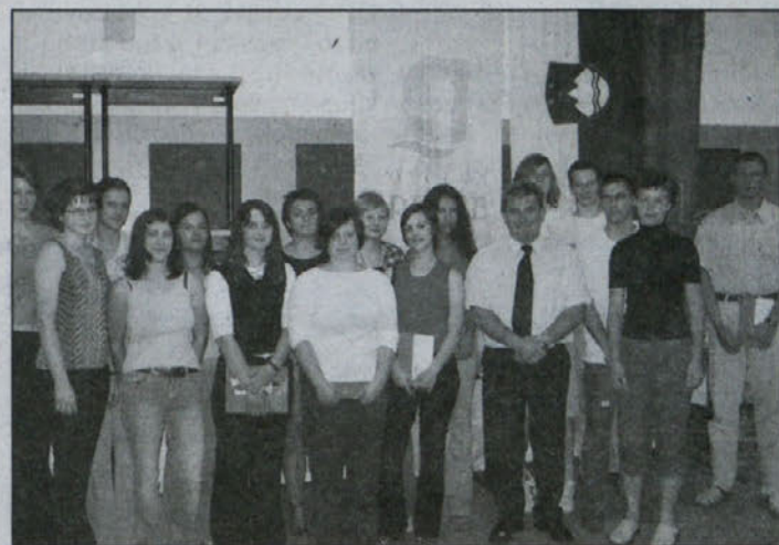
Župan s cvetom najuspešnejših ekonomsko komercialnih maturantov

Župan je v nagovoru mladim poudaril, da je znanje tisto, v kar bo občina vlagala in ki je vpleteno tudi v ključne občinske dokumente. Poudaril je, da se občina razvija v smeri višjega in visokošolskega izobraževanja in izrazil