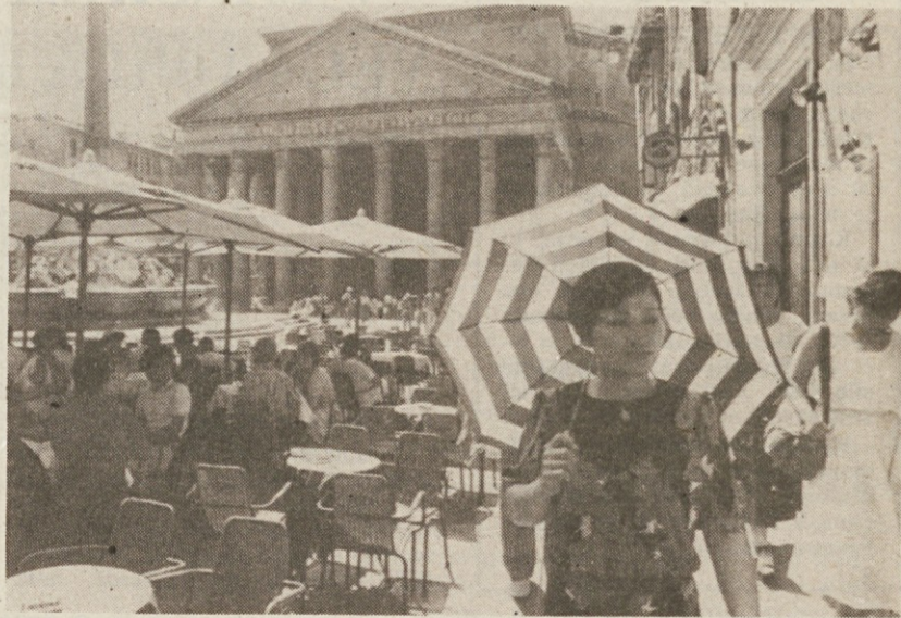
Japonska turistka se brani sonca na Trgu Pantheon v Rimu

Zaradi izredne vročine in suše skorajda po vsem sredozemskem območju izbruhnijo požari. O posebno veliki škodi, ki so jo povzročili plameni, poročajo iz Grčije. V Italiji so se včeraj borili proti ognju zlasti v Laciju, Bazilikati in Toskani, v Jugoslaviji pa je posebno hud požar izbruhnil v bližini Dubrovnika, kjer je gasilec priletelo na pomoč tudi italijansko letalo. Včeraj so na Korčuli našli trupla štirih oseb, ki so izgubila življenje v plamenih najbrž že v četrtek.