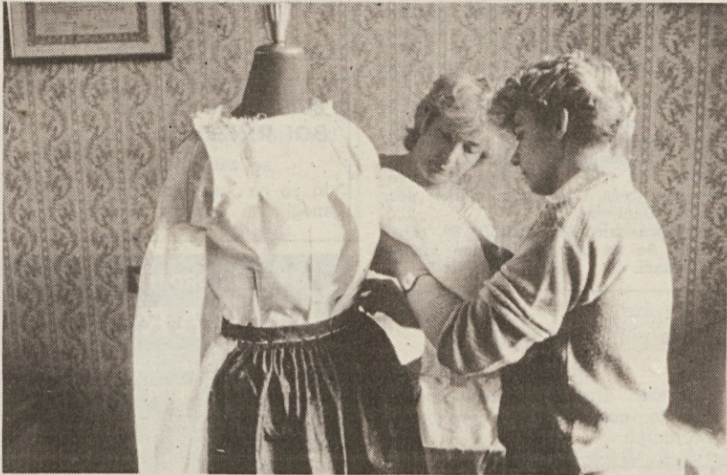
Nevesta pri šivilji, ki ji kroji poročno nošo

moške narodne noše s kraškega področja?«