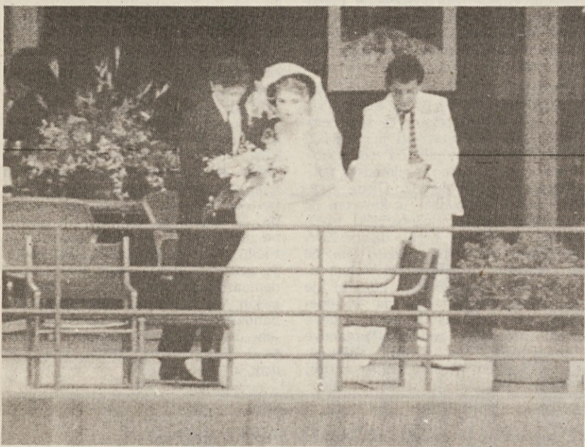
Slovita ameriška pevka lahke glasbe Madonna se je včeraj poročila v Malibuju v Kaliforniji z igralcem Seanom Pennom. Na sliki vrže šopek množici oboževalcev, ki se je zbrala pod balkonom vile