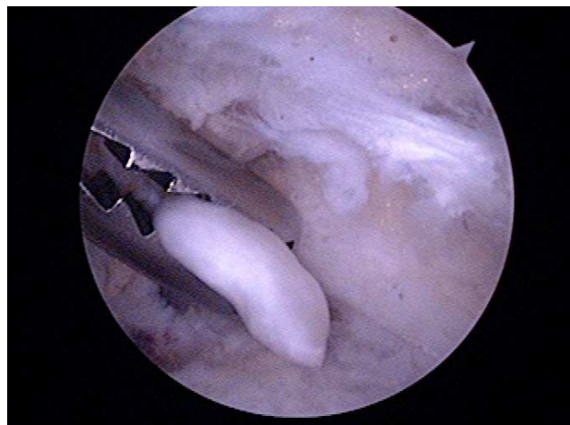
Slika 2 Odstranjevanje prostega telesa z artroskopsko prijemalko iz sprednjega kompartimenta komolca pri OCD.

Pri 10 bolnikih smo napravili povrtavanje defekta, pri 6 smo odstranili prosta telesa, pri 6 smo dodatno odstranili naplastitve na posterolateralnem delu olekranona in glavici humerusa in odstranili posterolateralni del sklepne ovojnice. Povprečna starost teh bolnikov je bila 20 let (12-25). Večina teh bolnikov (11) dve leti po artroskopiji komolca ni imela bolečin in normalno gibljivost komolca v vse smeri. 3 bolniki pa so pri intenzivni aktivnosti (npr. šport ali fizično delo) imeli manjše bolečine in ostala jim je 5-10 stopinjska flektorna kontraktura. Povprečni Mayo elbow score se je povečal od 56.4 pred artroskopijo na 92.5 dve leti po njej. Vsi bolniki so po končani rehabilitaciji opravljali iste aktivnosti kot prej preden so nastale težave komolcem.