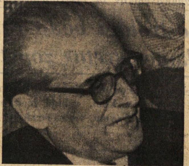
Predsednik republike Giovanni Gronchi

Medtem ko se s pospešenim tempom bližamo vladi levega centra, se desnica in skrajna fašistična desnica zaganjata v KD in hudo napadeta njeno odločitev v Neaplju. Fašisti opletajo celo s epoposajto marksizma, ki se baje dviga nad Italijo.