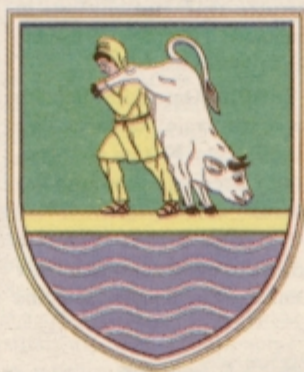
Grb občine Hajdina

Prejšnji četrtek so hajdinski svetniki govorili tudi o ponovni priključitvi dela Hajdine okrog