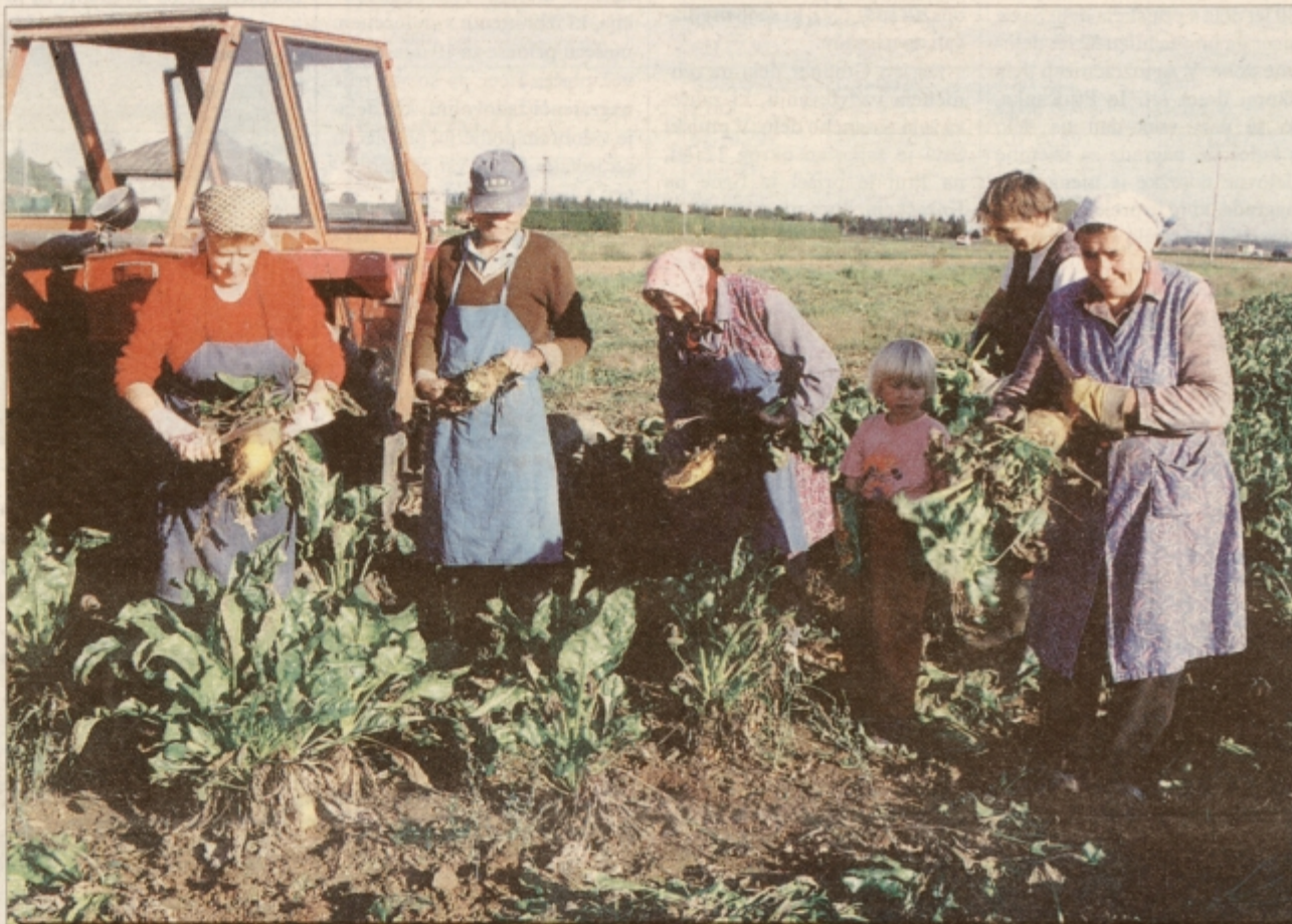
Glede na poletno sušo je pridelek krmne pese dober, zato je treba izkoristiti lepo jesensko vreme in ga čimprej pospraviti.

SPODNJE PODRAVJE / NOVEMBRA NAJVEČJA VAJA SLOVENSKE VOJSKE