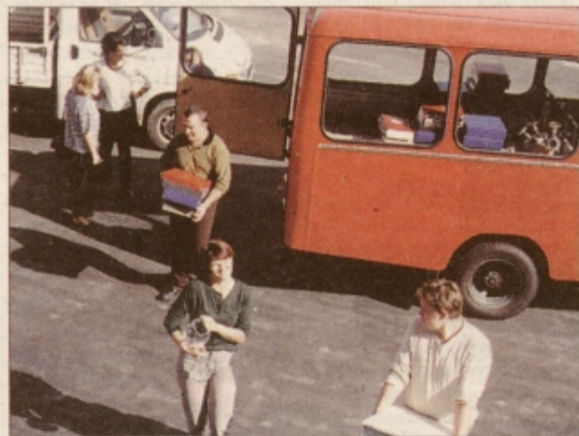
Delavci občinske uprave med preseljevanjem v nove prostore v večnamenskem poslovnem objektu.

moženje služi le prebivalstvu ene nove občine, pripada tej občini, če pa služi prebivalstvu dveh ali treh občin, pa si občine delijo premoženje po deležih.