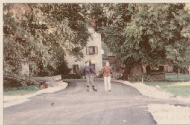
Cesta skozi turniški park asfaltirana.

Prebivalci turniškega parka so si končno oddahnili. Po dolgih prizadevanjih - aktivnosti so vodili preko četrti Breg - so končno le uspeli prepričati odgovorne, da je asfalt skozi turniški park nujen. Prvotno je bila sicer njihova pobuda, ki so jo spravili tudi na mestni svet, zavrnjena, te dni pa so položili 400 metrov asfalta, ki je proračun mestne občine Ptuj stal tri milijone tolarjev. Cesta skozi turniški park je kategorizirana javna pot, torej namenjena vsem občanom.