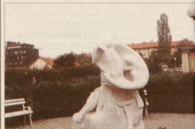
Poškodovan kip v parku za ptujsko lekarno.

V oddelku za okolje in gospodarstvo infrastrukturo mestne občine Ptuj so povedali, da bodo za sanacijo kipa poskrbeli, obenem pa opozorili na uničene luči javne razsvetljave na tem mestu. Da o tistih v mestnem parku sploh ne govorimo - uničujejo jih iz tedna v teden. MG