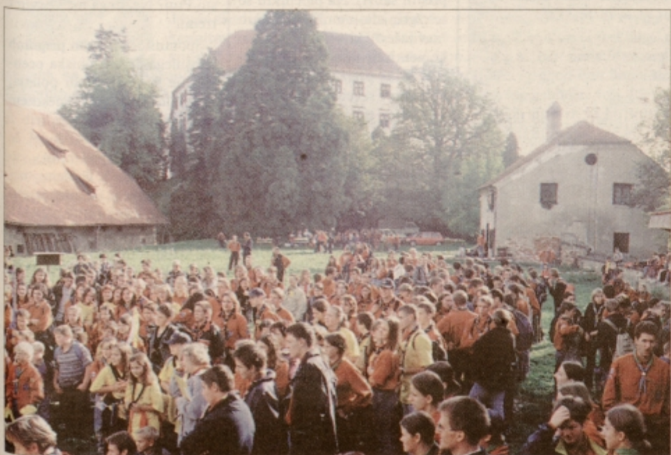
Skavti mariborske župnije so za letošnje srečanje izbrali ptujski grajski hrib