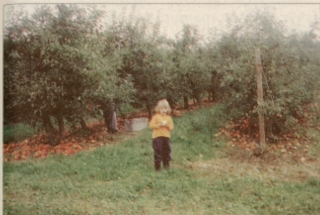
Na območju voličinske sadne ceste v dobrih pridelajo okoli 4500 ton jabolk

SLOVENSKA BISTRICA / MLADI LIKOVNIKI V GRADCU IN BÄRNBACHU