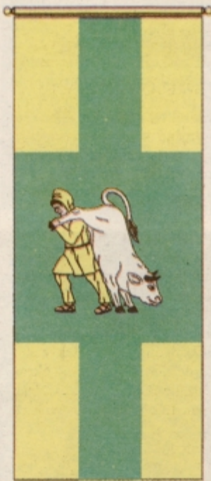
Zastava občine Hajdina