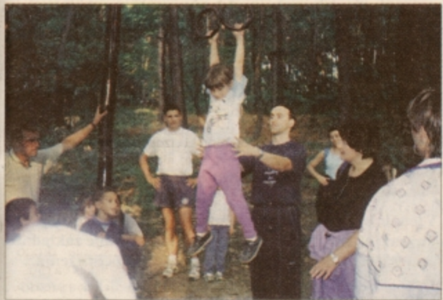
"Ati, dvigni me!" V Ljudskem vrtu so se na trimsko stezo podali otroci in starši.