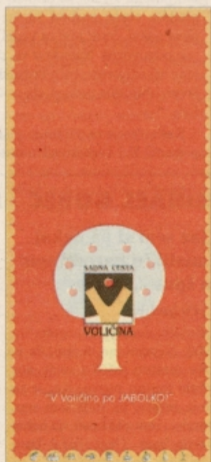
Prikaz sadne ceste v prospektu "V Voličino po jabolko"