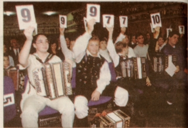
Ocene za "tehnično vrednost" so nastopajoči podeljevali drug drugemu ...