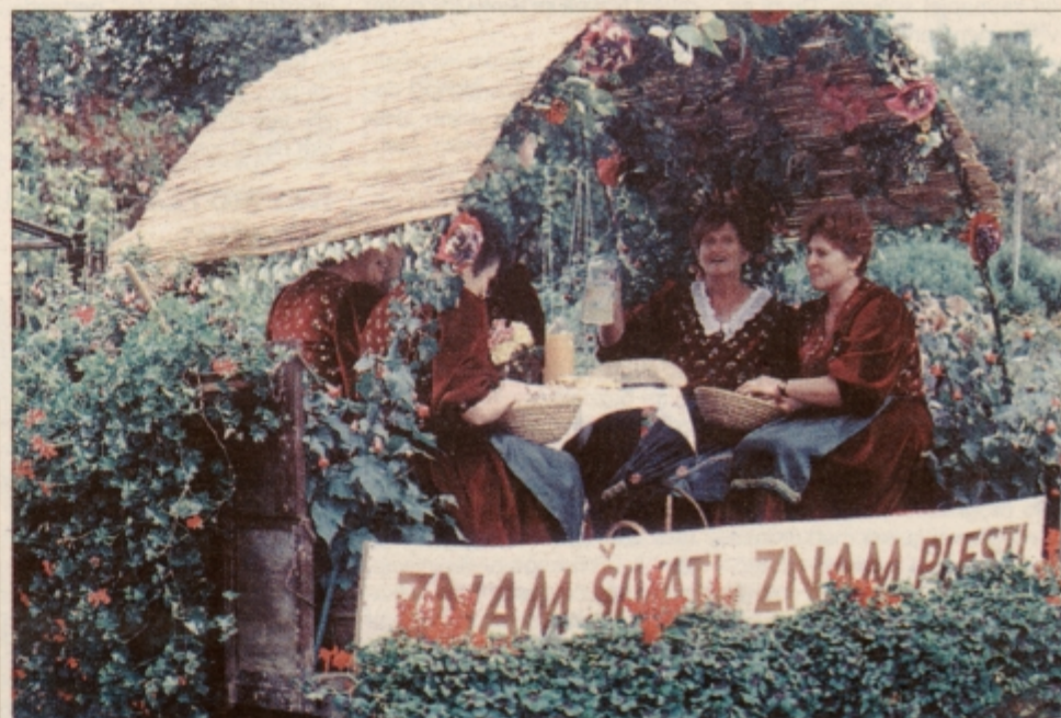
V povorki so se predstavile tudi prizadevne juršinske gospodinje.