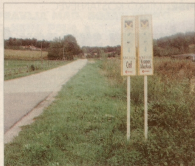
Sadja željnega obiskovalca do kmetij usmerjajo razpoznavne table

S sadno cesto so v Voličini prejšnji mesec dobili tudi prospekt, ki ob natančnem seznamu pridelovalcev jabolk predstavlja turistične znamenitosti ob cesti, obiskovalcu pa ponuja pregleden zemljevid območja krajevne skupnosti Voličina.