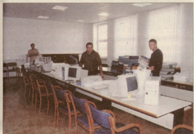
Seje občinskega sveta bodo odslej potekale v novi, bistveno večji in sodobno opremljeni sejni sobi