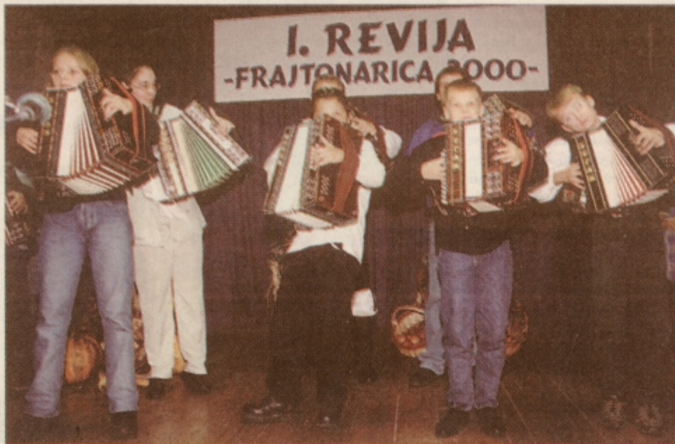
Mladi harmonikarji s frajtonarico so nastopili tudi skupaj