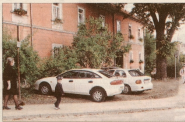
Še ena zelenica, ki so jo zasedli avtomobilisti.

Ker to območje ni predvideno za parkiranje v nobenem primeru, bodo sedaj morali odgovorni poseči po neljubih ukrepih. Lisice že čakajo; v začetku so