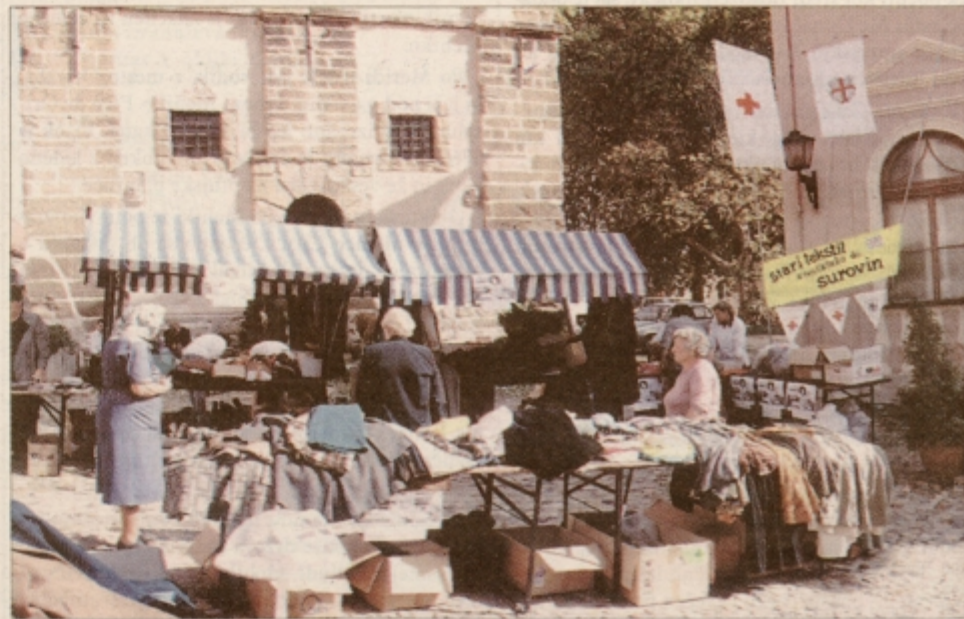
Stojnica z oblačili in usnjem na Slovenskem trgu.