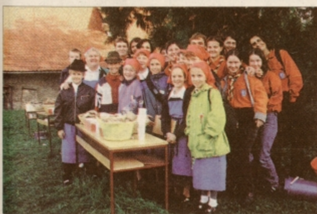
Ko je zmanjkalo hrane iz nahrbtnika, je na pomoč priskočila lükarica Fefa iz Moškanjcev s kruhom z zaseko in seveda "svojimi" skavti

Na turnirskem prostoru za žitnico na ptujskem grajskem hribu je bilo v soboto srečanje skavtov mariborske škofije, imenovano Štrti jam, ki se ga je udeležilo več kot štiristo mladih. Moto letošnjega srečanja, ki ga skavti mariborske župnije pripravijo vsaki dve leti v drugem kraju, je bilo: "Kdor z mestom ne trpi, naj se z mestom ne krepi," vzeti iz ptujskega statuta iz leta 1376.