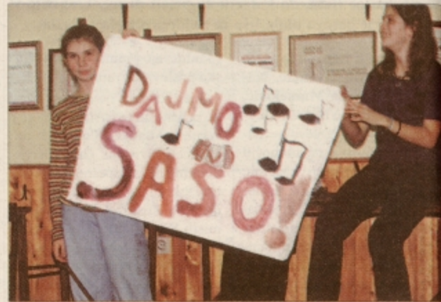
... za "umetniški vtis" pa so poskrbele navijačice ...