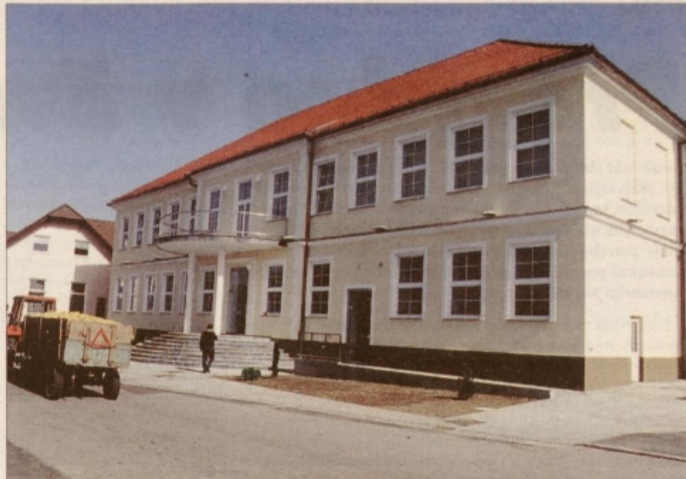
Center občine Markovci je dobil s preureditvijo in obnovitvijo poslopja nekdanje osnovne šole v večnamenski poslovni prostor novo, predvsem pa lepšo podobo

Tako na primer pravilo lege nepremičnine pomeni, da pridobi premoženje prejšnje občine tista novo ustanovljena občina, na območju katere ta nepremičnina leži, in to v celoti. Pravilo po namenu pa temelji na ugotovitvi, kateremu prebivalstvu nove občine služi določeno premoženje. Če pre-