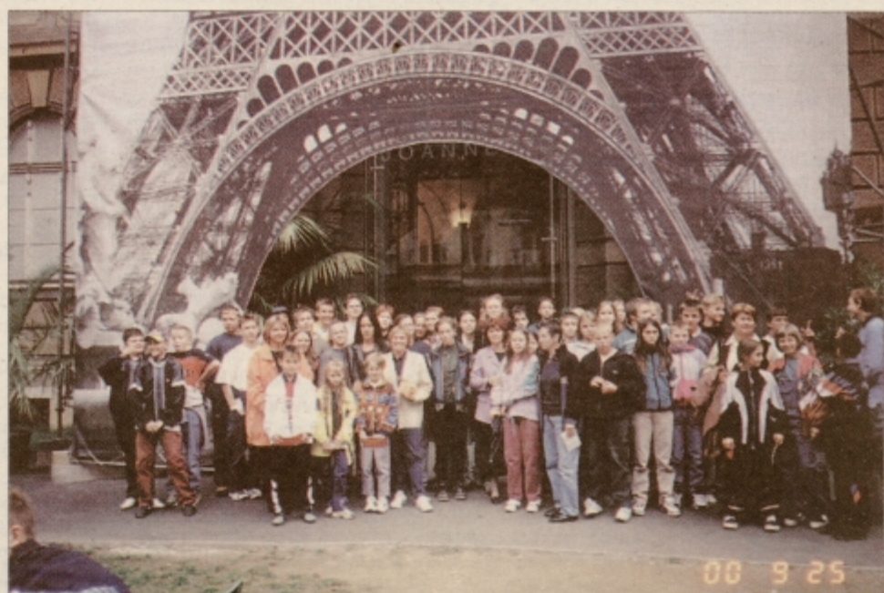
Mladi likovniki iz slovenjebistriške in oplotniške občine pred graškim deželnim muzejem Joanneumom po ogledu pregledne razstave Paula Gauguina.