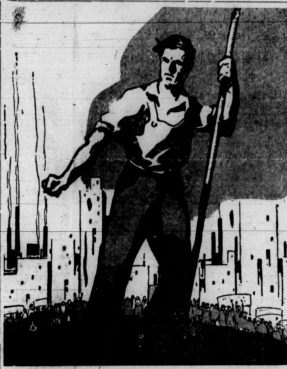
Na Prvega maja, na naš delavski praznik, kličemo delavce znova: Pridite v naš krog! Organizirajte se v klubih JSZ! Naprej, sodrugi in sodružice!