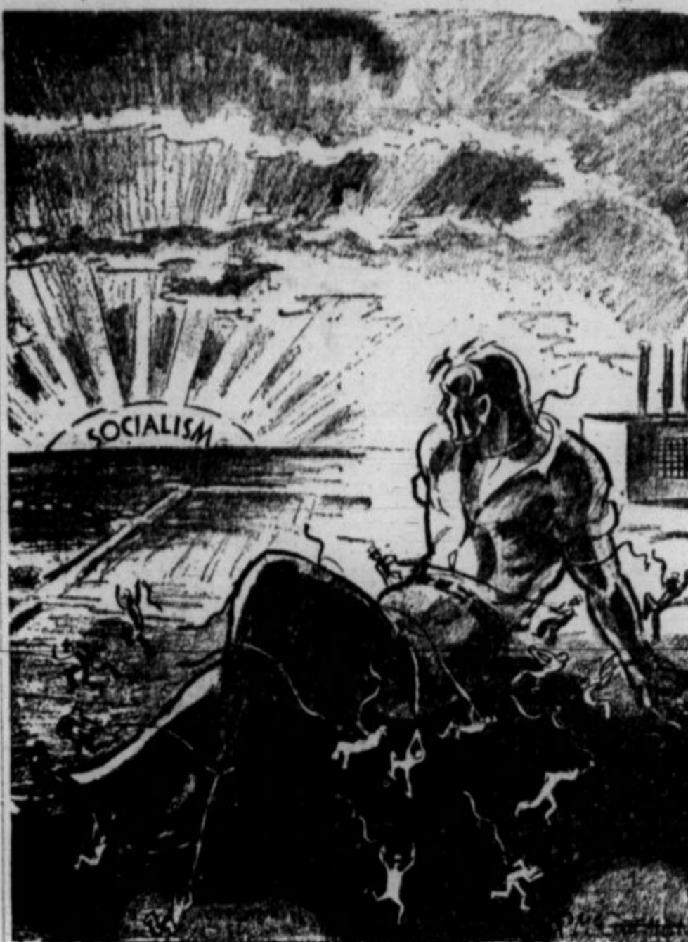
Socialistična uredba družbe je edini izhod iz negotovosti, brezposelnosti in mizerije. Delavci, organizirajte se!