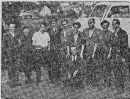
Ekipi po končanem delu.

Kot po navadi, tudi ob koncu te akcije nikdo ni rad govoril o težavah, češ, povsod je treba premagati ovire in težave, kjer gre za napredno in ljudstvu koristno delo in so s temi tudi pri tej akciji računali ter dosegli proti