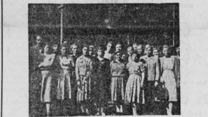
Včeraj se je vrnila v Ptuj mladinska delovna brigada »Dr. Jožeta Potrča«, ki je bila tekom 2 mesecev pri graditvi ceste Vrhnika—Logatec štirikrat udarna

PRODANIH BO 120 ENO- IN DVOSTANOVANJSKIH HIŠ Ptuj, 29. sept. (VV). Iz fonda splošnega ljudskega premoženja bo na področju ptujskega okraja prodanih delavcem in nameščencem v smislu predpisov čl. 17 uredbe o zidanju stanovanj-