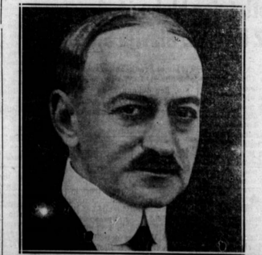
Novi provizorični predsednik republike Kube dr. Carlos Manuel de Cespedes, ki ga je odobrila tudi ameriška vlada.

V SOBOTO 2. SEPTEMBRA Pridite Vsi! Pridite gotovo!