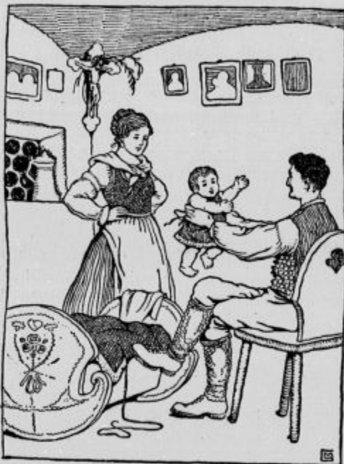
Tedaj raztegne oče svoje roke proti njemu in pravi: »Francek, pojdi k meni!« Otrok se je takoj umiril, raztegnil svoji ročici proti očetu in se zasmejal z vsem obrazkom.

»In vendar si ti moj angel varih, ki me varuješ kot otroka in mi niti za trenotek ne odtegneš svojega nadzorstva,« jo veselo zavrne mož.