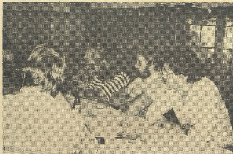
Seminarja so se udeležili tudi vodje TOZD

3. Ostanje pa stroški sestanka: avtomatično pritegne ostale k razpravi. Če je razprava prehuda, vodja prekine z enim zaključkom in pozove še druge na dajenje predlogov.