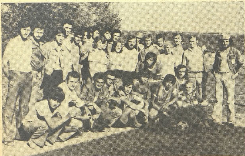
»ORB staklari YU Jasenovac '75«

Malo je živih prič iz tega taborišča, saj so ustaši jetnike dobro nadzorovali.