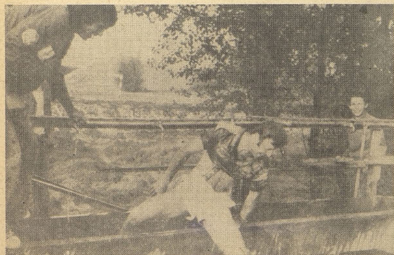
Na splošno veselje cele brigade smo ob zaključku skopali tudi našega namestnika

Naj omenim, da je delo potekalo od 6. ure zjutraj do 12. ure, vendar smo v popoldanskem času s kulturnim delom izkoristili skoraj ves prosti čas. Če omenim, da smo vsako dekačo morali pripraviti brigadni večer, radijsko oddajo, taborni oganj s kulturnim programom, izdati deset stenskih časopisov in tri biltene, je ostalo kaj malo časa. Udeleževali smo se tudi na športnem področju, vendar ne z najboljšimi rezultati. V šahu so naši predstavniki brigade zasedli prvo mesto. Vsaka brigada pa je morala z udeležbo na raznih tečajih dokazati svoje sposobnosti. Ta akcija je bila do-