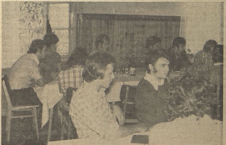
Sodelovali pri predavanju

b) V drugem delu pa se bom omejil konkretno na organiziranost po posameznih področjih. Ko smo ravno pred letom dni na 9. kongresu ZSMS sprejemali kongresne dokumente smo se jasno zavedali, da reorganizacija ZSM ni in ne more biti enkratni poseg, ki ga je možno uspešno opraviti, ampak je to stalen proces spreminjanja organizacije, vsakodnevno prilagajanje organiziranim družbenim odnosom in mladim ljudem skratka sredinam, kjer deluje. Vsi deli mladine, tako delavsko-kmečka, dijaška, študentska se povezujejo v svojih akcijah in dejavnostih na enotnih in jasno izraženih idejno političnih izhodiščih. Pri tem je potrebno poudariti, da je v OO ZSMS v KS vključena vsa mladina ne glede na to, kje je zaposlena ali že drugače organizirana. Njeno delo mora biti povezano z družbeno problematiko KS, torej da tu mladi izražajo in uveljavljajo svoje interese kot občani in so povezani z interesi vseh občanov v aktivu KS, le-ti pa se usklajujejo in uveljavljajo znotraj enotne fronte SZDL. Poseben poudarek se daje občinski organizaciji (Nadaljevanje na naslednji strani)