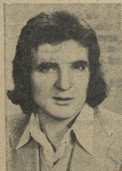
SEKRETAR MLADINE V NAŠI OZD — KOORDINACIJSKEM SVETU ZSMS

Zaposlen je kot strojni ključavničar v TOZD-V. Aktiven član mladine na nivoju OZD. Je tudi član samoupravnih organov in član ZK.