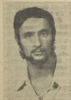
PREDSEDNIK MLADINE V NAŠI — KOORDINACIJSKEM SVETU ZSMS

Rojen 11. 12. 1955 v Celju. Zaposlen je kot vzdrževalec pri avtomatski proizvodnji. Aktivno se vključuje pri delu v ZSM predvsem v krajevni skupnosti. Je član samoupravnih organov in se udeležuje na športnem področju.