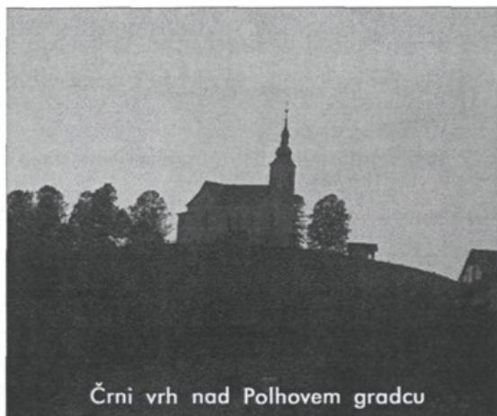
Črni vrh nad Polhovem gradcu