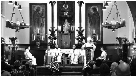
Slavnost v cerkvi svetih bratov Cirila in Metoda za Bežigradom

V župnijski cerkvi svetih bratov Cirila in Metoda za Bežigradom v Ljubljani so se preteklo nedeljo, 25. oktobra, slovesno spomnili 80. obletnice evharističnega kongresa, ki je bil leta 1935 na Plečnikovem stadionu v prestolnici. Kongres je sklical tedanji ljubljanski škof dr. Gregorij Rožman, da bi pred bližajočimi se svetovnimi viharji utrdil versko in narodno zavest slovenskih katoličanov.