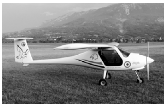
Pipistrelov Virus SW 80 Garud

Pipistrel se je moral pogodbeno zavezati, da bo po tretjem letu dobavil še dodatnih 100 letal, če bo naročnik to zahteval. Za prihodnjih deset let mora zagotoviti tudi vse rezervne dele in tehnično podporo. Pilote oziroma inštruktorje letenja v Indiji bo usposabljal Pipistrelovo partnersko slovensko podjetje Pipistrel Academy.