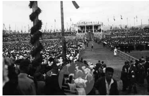
Plečnikov stadion med potekom kongresa