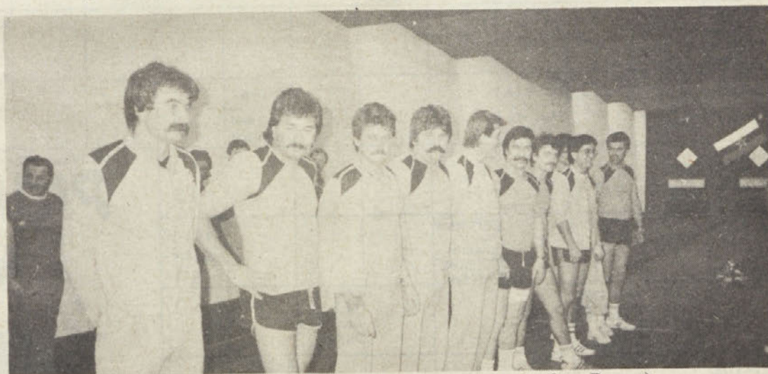
Zmagovalna ekipa Konstruktorja na IX. memorialu Ivana Kočevarja

Hvala za razumevanje! Organizacijski odbor