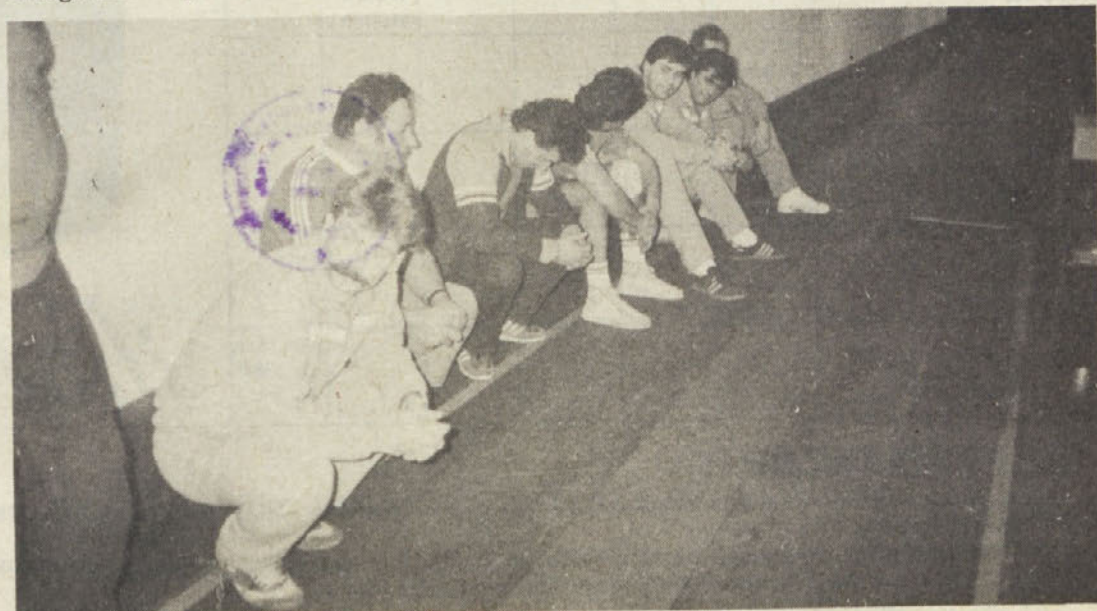
Razočarana naša ekipa