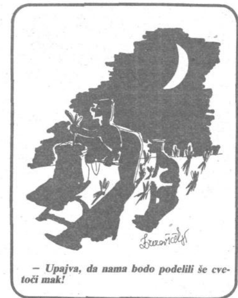
— Upajva, da nama bodo podelili še cvetoči mak!

Zdaj so sklenili, da bodo temu naredili konec. Kako? Po 10 do 15 sosednjih vrtičkarjev se je združilo v samoupravne vrtičkarske enote. Te se prav sedaj dogovarjajo, kako bi pospravili svoje vrtnice tako, da bi ne vzbujali neprijetnih občutkov mimoidočih. Tako bodo fižolnice, sode in drugo vrtičkarsko opremo pospravili na enoten način. Ne bodo jih več pokrivali za zimsko zaščito s kričnimi polivinili, temveč le z brezbarvnimi (prosojnimi) ali temnim polivinilom itd.